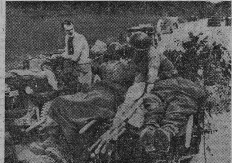
Soldados norteamericanos gravemente heridos son evacuados a la retaguardia. El coche va camuflado con camaje a causa de los bombardeos y ataques de los cazas rojos.