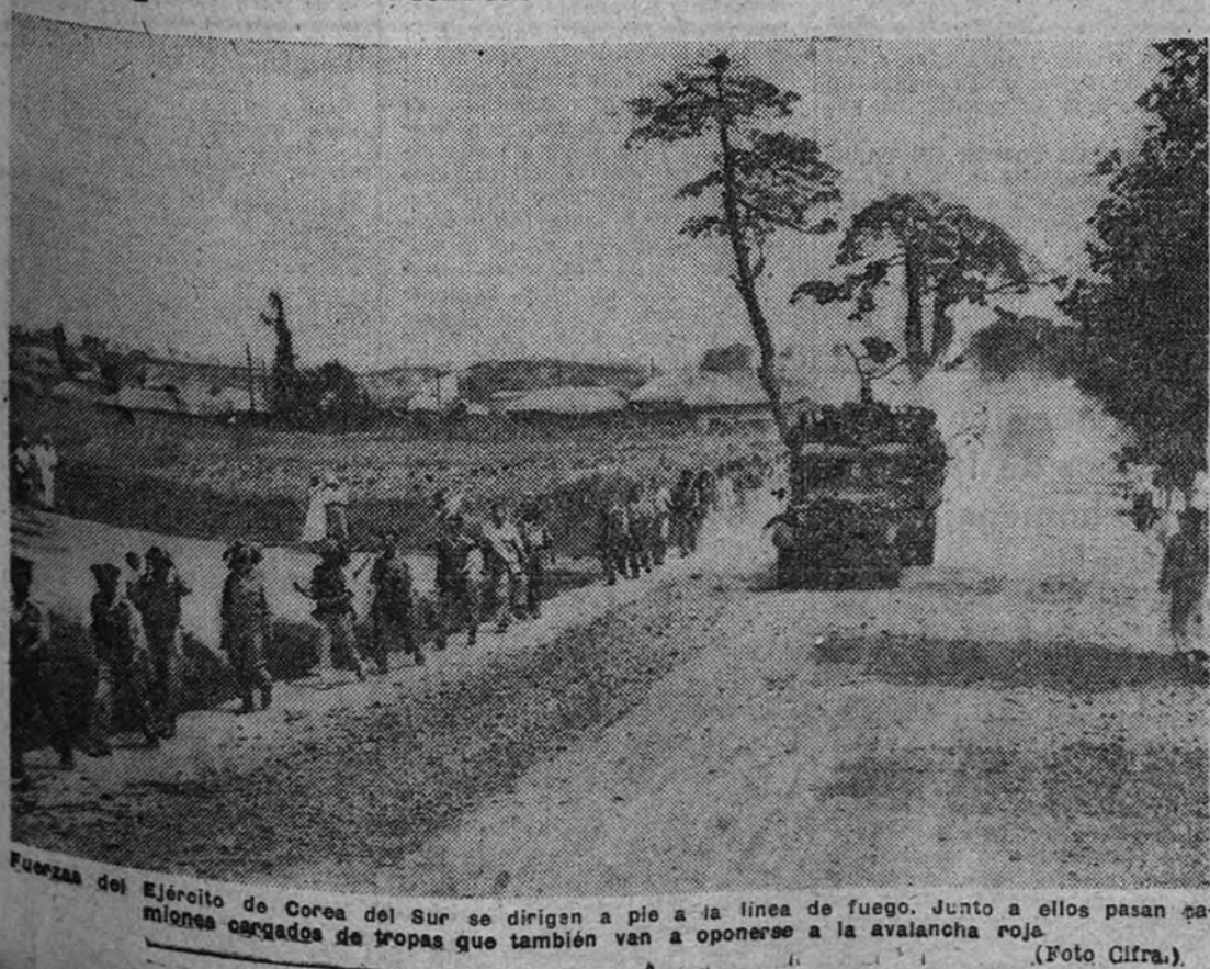
Fuerzas del Ejército de Corea del Sur se dirigen a pie a la línea de fuego. Junto a ellos pasan camiones cargados de tropas que también van a oponerse a la avalancha roja.