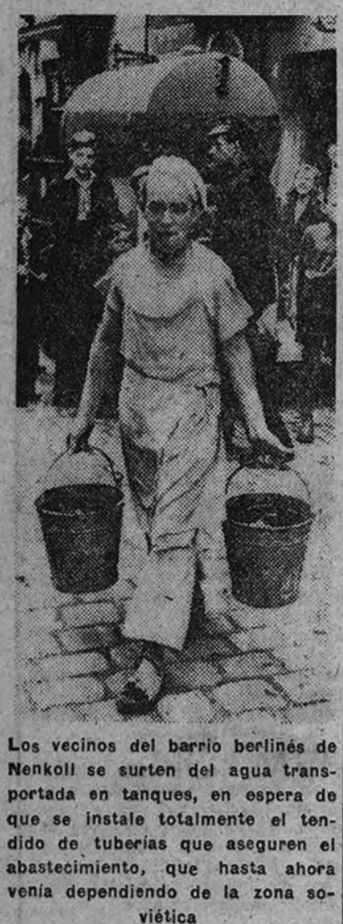
Los vecinos del barrio berlinés de Nienkoll se surten del agua transportada en tanques, en espera de que se instale totalmente el tendido de tuberías que aseguren el abastecimiento, que hasta ahora venía dependiendo de la zona soviética.