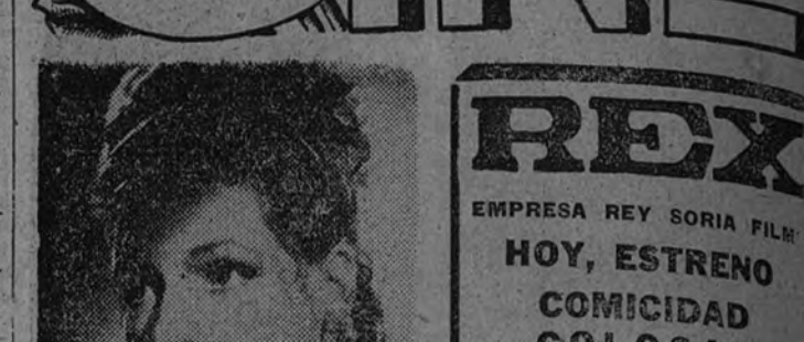
HOY, ESTRENO COMICIDAD COLOSAL