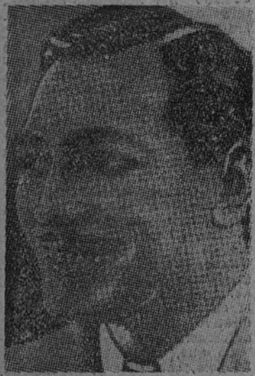
EL PRINCEPE GITANO , de su regreso de América, descansa en nuestra capital, aunque próximamente comenzará el montaje de su nuevo espectáculo, original de Ochoaiza, Kándero y maestro Solano, con que se presentará ante el público madrileño la próxima temporada.

FUENCARRAL (REFRIGERADO) EXITO INMENSO DE LOLA FLORES Y MANOLO CARACOL EN "La maravilla errante" (de Quintero, León y Quiroga) CON Nati Mistral y Tony Leblanc