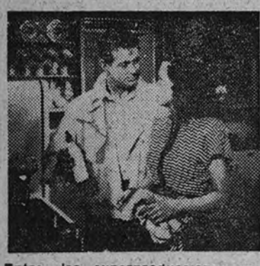
Entre las superproducciones extranjeras que cifera para a conocer la temporada próxima figura "Sucedio en la quinta avenida" con Don Detore y Ann Harding