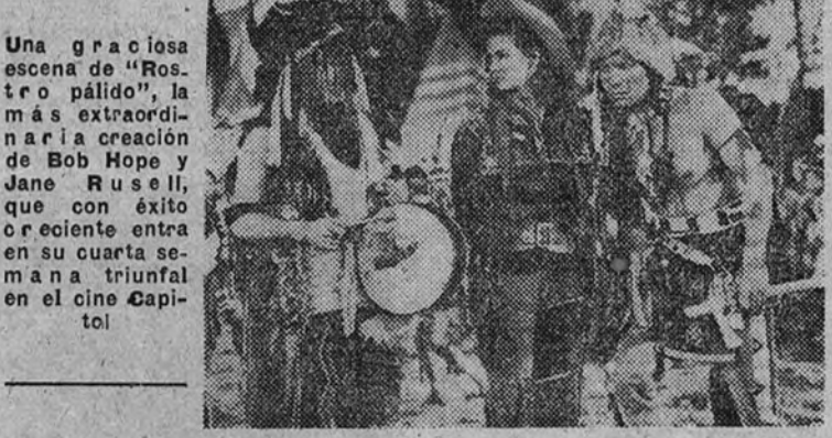
Una graciosa escena de "Rostro pálido", la más extraordinaria creación de Bob Hope y Jane Russell, que con éxito oriente entra en su cuarta semana triunfal en el cine Capitol