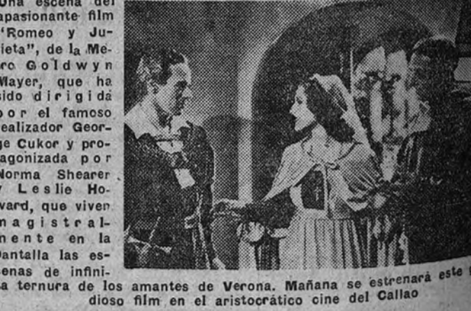
Una escena del apasionante film "Romeo y Julieta", de la Metro Goldwyn Mayer, que ha sido dirigida por el famoso realizador George Cukor y protagonizada por Norma Shearer y Leslie Howard, que viven magistralmente en la pantalla las escenas de infinita ternura de los amantes de Verona. Mañana se estrenará este grandioso film en el aristocrático cine del Calao