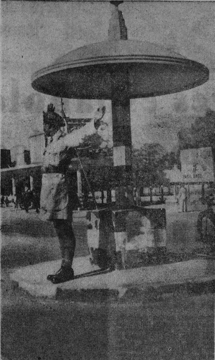
Policía de tráfico, en Karachi

El aspecto general de la población es oriental, sobre todo por los minaretes de las mezquitas que se alzan por doquier. Pero en los centros comerciales, como en Elphinstone Street, cuya foto aparece en estas líneas, los rútilos de los comercios están redactados en inglés y el Occidente desdibujado al Oriente. Muchos hoteles y lugares de menor categoría, pero no por eso menos divertidos. Hay gran cantidad de cinematógrafos, pero sólo dos o tres en los que den películas en inglés.