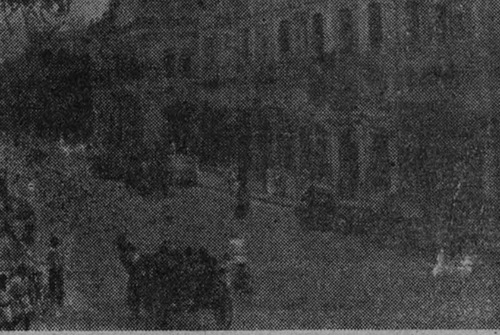
Elphinstone Street, de Karachi, capital de Pakistán

Los guardias de la circulación en Karachi dan una nota moderna, con su aire de directores de orquesta. Como se ve en la foto, están amparados del fuerte sol por una sombrilla de cemento. En otras calles la sombrilla es de lana, y el guardia se alza sobre un pinto.