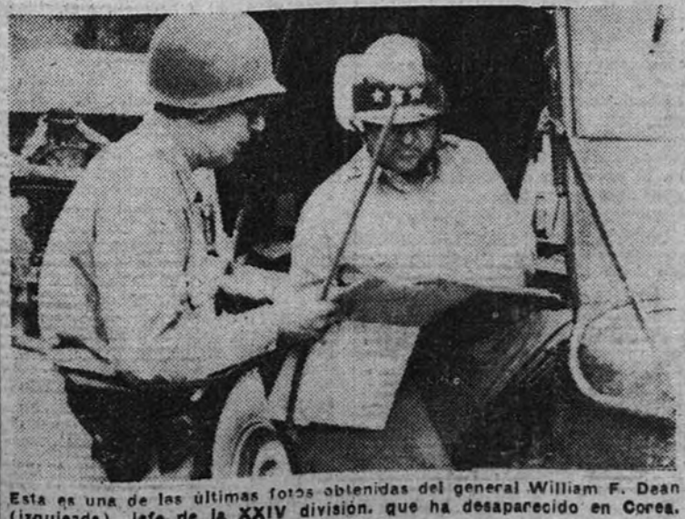
Esta es una de las últimas fotos obtenidas del general William F. Dean (izquierda), jefe de la XXIV división, que ha desaparecido en Corea.