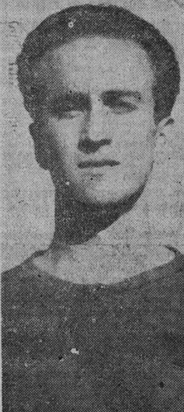
Basora, el gran extremo derecho de nuestra selección nacional, cuyo fichaje da como seguro un equipo italiano

BARCELONA.—La "Gazeta della Sport" publica con un título a cuatro columnas que los directivos del equipo italiano Inter Internacional estuvieron en el Brasil en contacto repetidas veces con el extremo derecho barcelonista Basora. El periódico italiano da como noticia sensacional el ingreso de Basora en el Inter. En el Brasil—afirma—, Mauro ha estado en largo contacto con Basora, extremo derecho del equipo nacional español. Compara luego a Basora con el uruguayo Chiglia, y afirma que fueron, además de los dos mejores extremos derechos del torneo mundial, figuras que individualmente deben ser colocadas en primerísimo plano de la Copa Jules Rimet. Basora—añade—posee un juego rapidísimo y brillante, y por encima de todo esto tiene un disparo verdaderamente excepcional. Lo que más sorprende es que se da el caso como cosa cierta, puesto que se dice que el cupo de extranjeros en el Inter será completado por Basora, Wilkes y Myers. (Añil.)