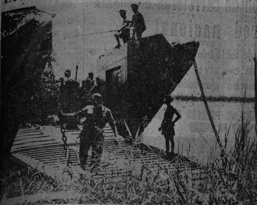
Unidades anfibias francesas que han llegado a Indochina para tomar parte en la lucha contra los comunistas