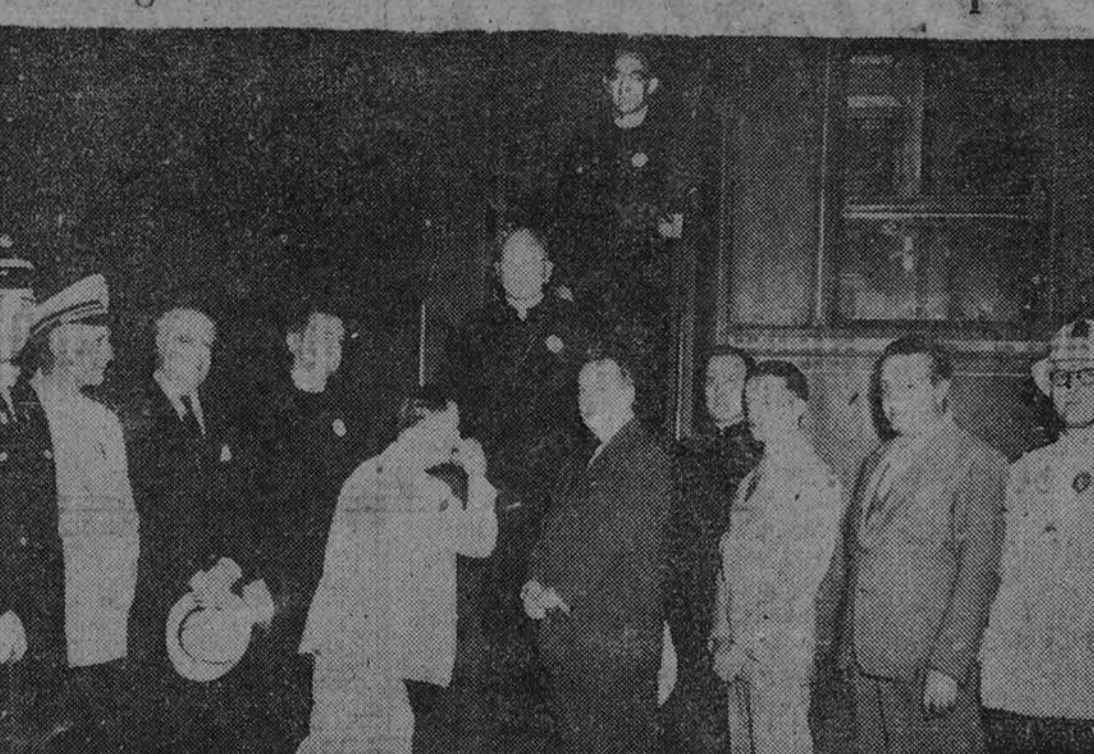
El obispo de Honduras Británicas a su llegada a Barcelona como presidente de un numeroso grupo de peregrinos norteamericanos que se dirigen a Roma