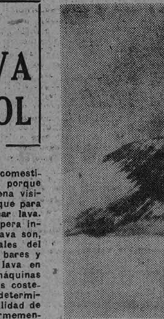
Una vista del Etna

Se observa un decidido empeño por parte de todos los panegiristas de Sicilia en basar metafóricamente la conocida actividad, iniciativa y audacia de los cataneses en la proximidad del Etna. «Cada catanense es un crater de pasión», he llegado a leer en un folleto de propaganda turística. No olvidemos—añadía el texto con irrefutable exactitud geográfica—que estamos a 38 kilómetros del centro central del Etna. Yo, que he visto la ciudad de Catania y su impresionante pero achacoso «pícan», puedo decir que la activa laboriosidad y la capacidad de iniciativa de los cataneses proceden más bien de su remota ascendencia fenicia que de su permanente proximidad volcánica. Si los cataneses de hoy hubiesen copiado al Etna actual se limitarían a sentarse con gesto fiero dentro de una cámara frigorífica. Tendrían las narices rojas de feo y, de vez en cuando, amenazarían con despatarrarse empujando sordas e inconsonantes flatulencias. Como es natural, no hacen nada de eso. Sin negar su capacidad de trabajo, los actuales cataneses son unas personas que sudan mucho porque hacen un calor de justicia en Catania, y, de momento, no tienen otra pasión que la habitual en esta época del año: tomar muchas «cassatas» en las terrazas de los cafés. Pero como la literatura tiene sus concesiones, sigamos creyendo que la laboriosidad, audacia e iniciativa de los cataneses procede de su proximidad con el apagado, estático y frío Etna.