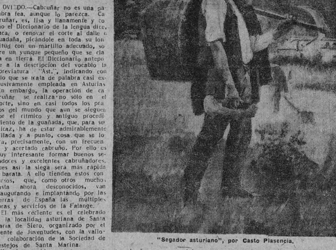
"Segador asturiano", por Casto Plasencia.

Estuvo organizado por el frente de Juventudes