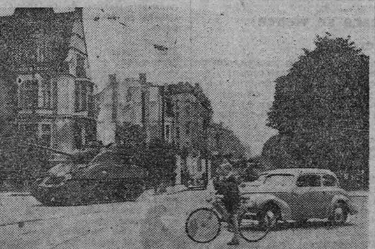
Tanques belgas patrullan por las afueras de Bruselas en prevención de posibles desórdenes ante el anuncio de la celebración de una gigantesca manifestación antileopoldista