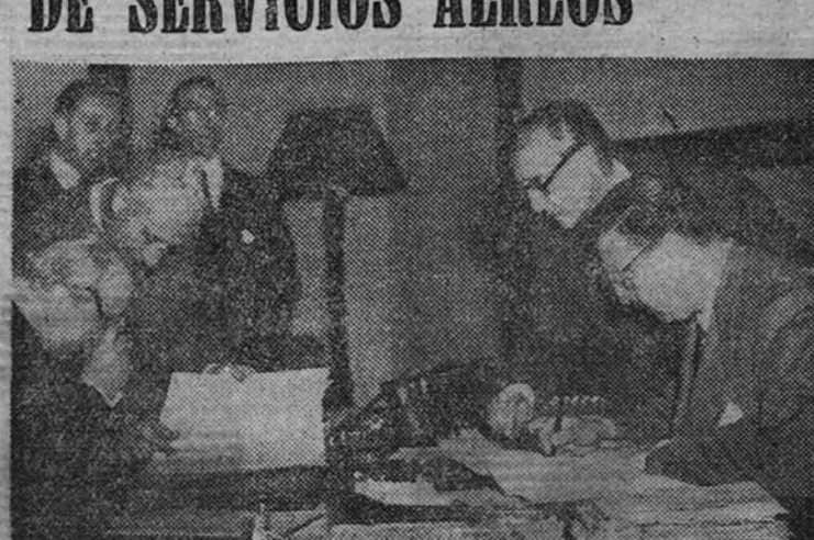
El señor Martín Artajo, Ministro de Asuntos Exteriores, y el embajador extraordinario señor Broje, en el momento de la firma de dicho acuerdo, que tuvo lugar en el Ministerio de Jornada