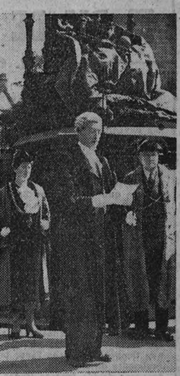
El alcalde de Newcastle vuelve a tocarse con la clásica peluca para cumplir un viejo rito que arranca de 1216. Consiste en una proclama que manda a los ciudadanos que guarden la "paz del Rey", prohibiendo armar escándalo y celebrar reuniones ilegales bajo pena de prisión.