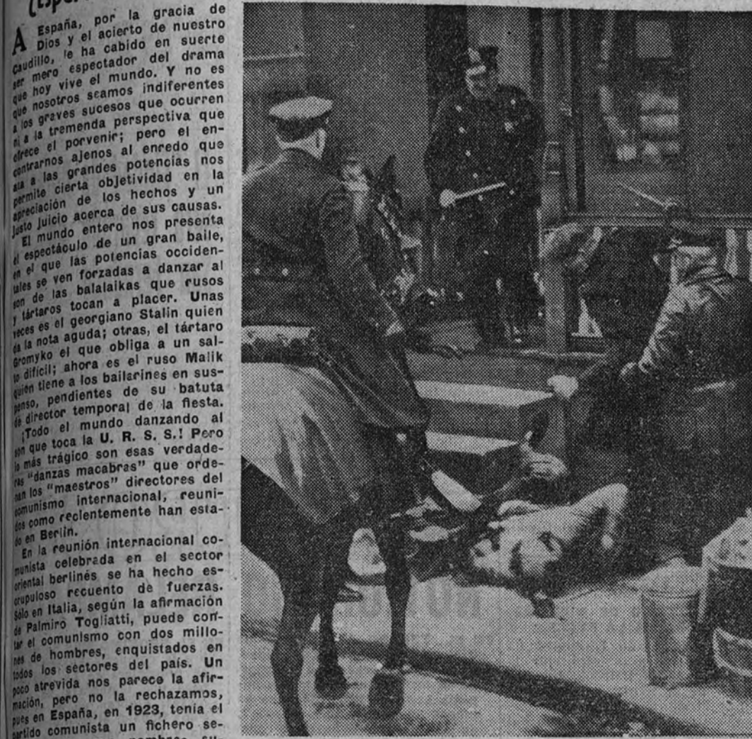
La Policía de Filadelfia interviene bastante activamente, como puede apreciarse, para sofocar un tumulto promovido por los elementos comunistas

A España, por la gracia de Dios y el aliento de nuestro pueblo, le ha tocado el turno de ser el escenario de un drama que hoy vive el mundo. Y no es un drama cualquiera, sino que nos lleva a la perspectiva que nos ofrece el porvenir; pero el enredo que se desarrolla en esta gran obra de teatro, que a las grandes potencias nos ofrece una clara objetividad en la representación de los hechos y un claro juicio acerca de sus causas. El mundo entero nos presenta el espectáculo de un gran baile, en el que las potencias danzan al son que toca la U. R. S. S. Pero no es un baile cualquiera, sino que es un baile de guerra, un baile de muerte. En este baile, los comunistas son los bailarines, y los demás países son los espectadores. Los comunistas, que se llaman a sí mismos "la vanguardia de la humanidad", están en realidad en la vanguardia de la guerra y la muerte.