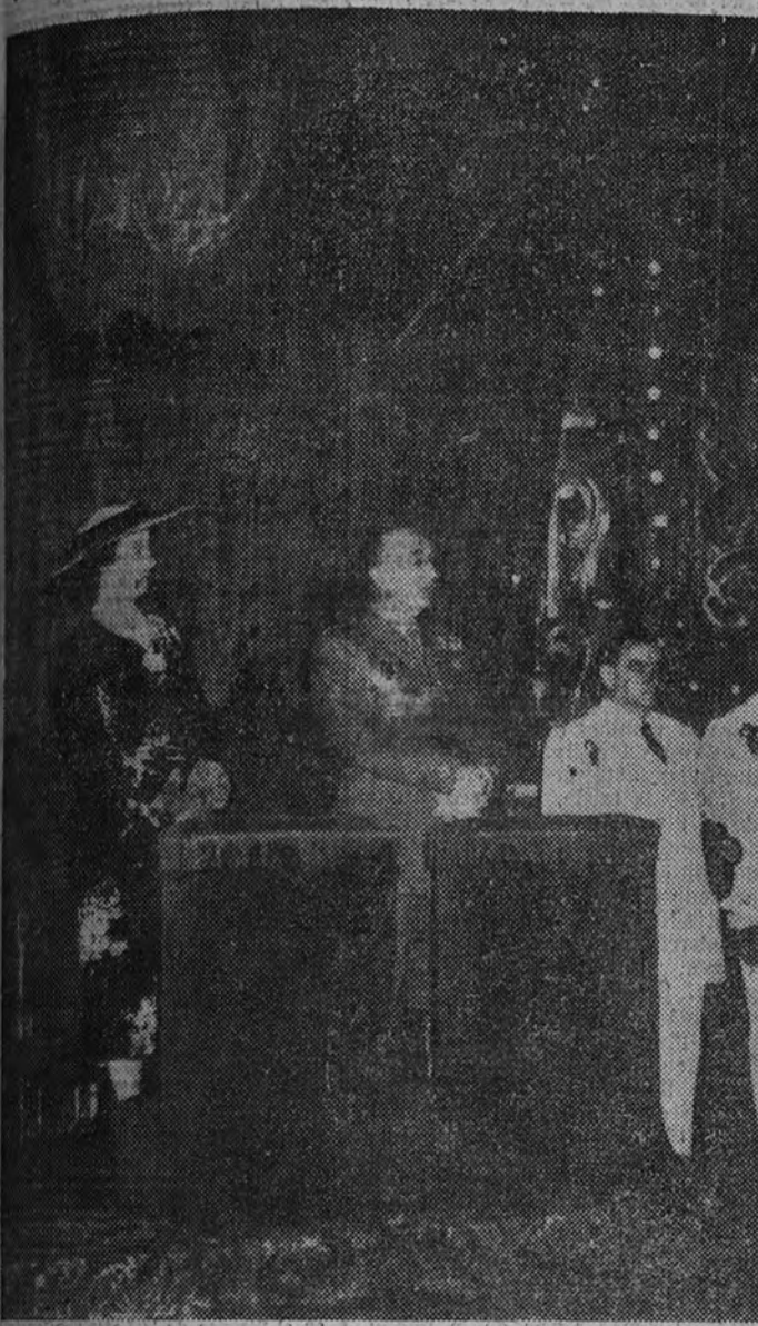
La Excelencia el Jefe del Estado, al que acompañaba su esposa, asistió a la tradicional salve que en la víspera de la festividad de la Asunción se celebra en la iglesia de Santa María.