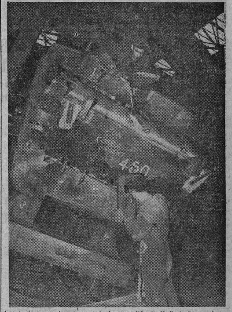
Los ingleses producen en serie tanques "Centurion" de 50 toneladas. Estos obreros proceden a dar los últimos toques a la torreta de uno de ellos. "Para Corea, urgente", reza la inscripción hecha con tiza en el blindaje. Ello no deja de ser un buen propósito o un ardid del fotógrafo. Porque la verdad es que, hasta ahora, Inglaterra no se bato al lado de sus gñerosos amigos.