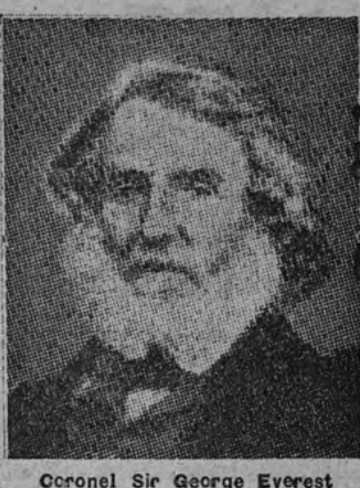
Colonel Sir George Everest

Nadie se le subió al Everest a "las patillas" UN CAMINO DE MUERTE DESDE DARJEELING