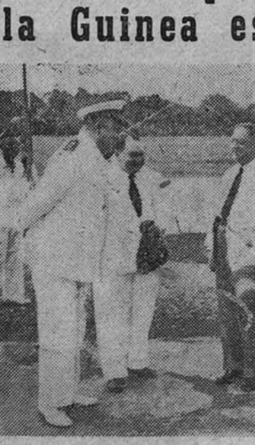
En el aeródromo de Fernando Poo, el gobernador general de los territorios españoles del golfo de Guinea, señor Ruiz González, recibe y da la bienvenida a las autoridades portuguesas de las colonias de Santo Tomé y Puerto Príncipe. La visita de las autoridades lusitanas es una prueba eloocuente de las relaciones de amistad existente entre las dos naciones peninsulares.