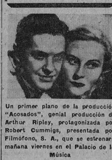
Un primer plano de la producción "Acosados", genial producción de Arthur Ripley, protagonizada por Robert Cummings, presentada por Filmófono, S. A. que se estrenará mañana viernes en el Palacio de la Música