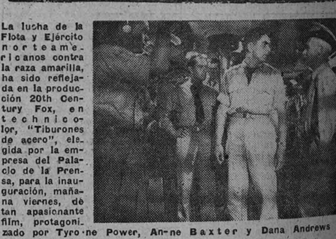
La lucha de la Flota y Ejército norteamericano contra la raza amarilla, ha sido reflejada en la producción 20th Century Fox, en technicolor, "Tiburones de acero", elegida por la empresa del Palacio de la Prensa, para la inauguración, mañana viernes, de tan apasionante film, protagonizado por Tyro-ne Power, Anne Baxter y Dana Andrews