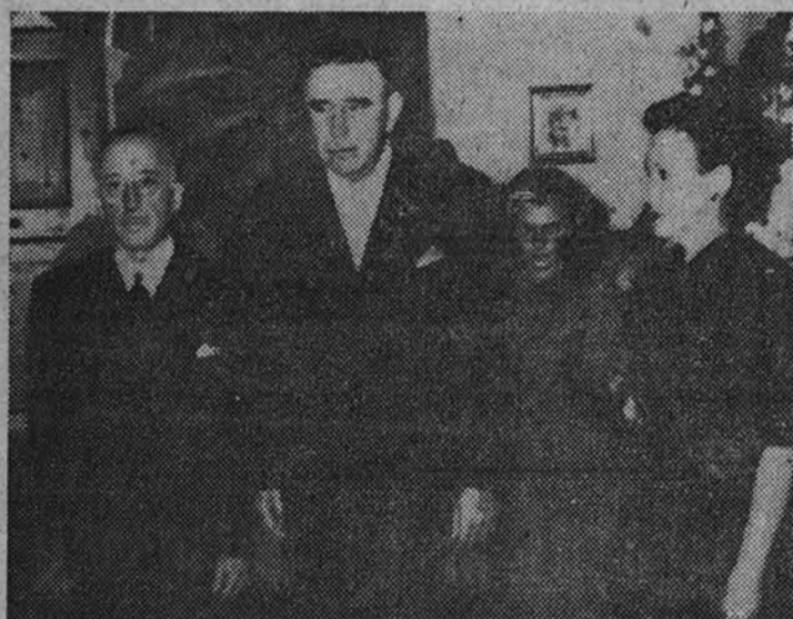
El Presidente Ulate en la Legación española en San José de Costa Rica, durante la recepción ofrecida por el ministro señor Cavanillas.