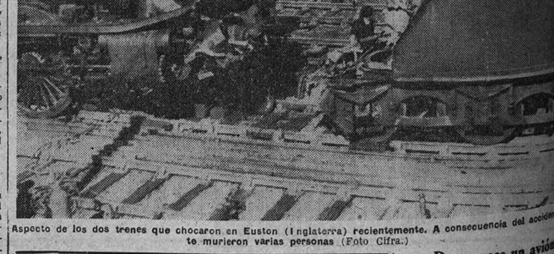
Desaparece un avión con diez personas a bordo

Aspecto de los dos trenes que chocaron en Euston (Inglaterra) recientemente. A consecuencia del accidente murieron varias personas