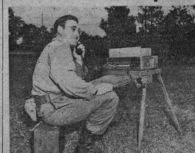
Nuevo cuadro de distribución adoptado por el Ejército norteamericano. Es tres veces más potente y su tamaño es exactamente la mitad del modelo anterior.