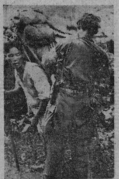
Un soldado surcoreano inspecciona la impedimenta de un refugiado que marcha de su pueblo ante la amenaza del avance rojo.