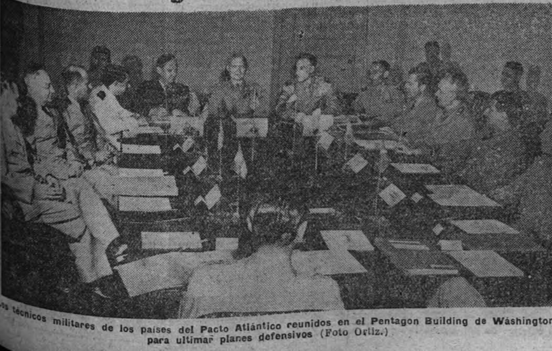
Los técnicos militares de los países del Pacto Atlántico reunidos en el Pentagon Building de Washington, para ultimar planes defensivos.