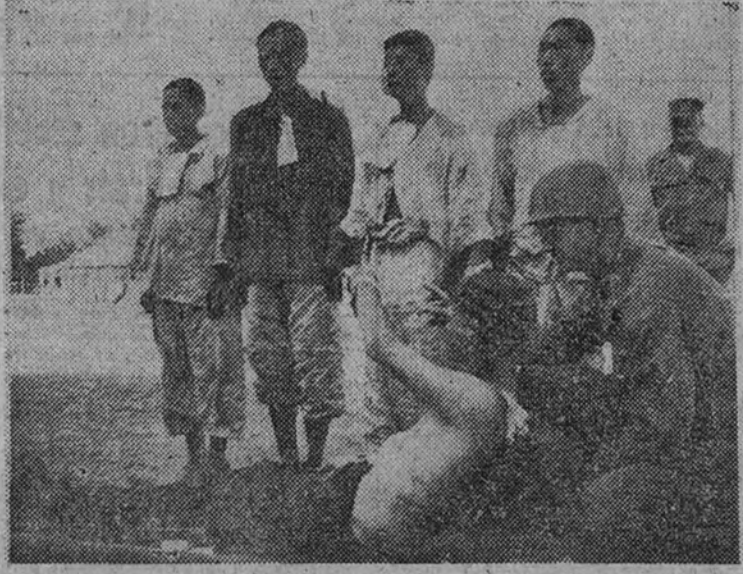
Un soldado norteamericano gravemente herido identifica a un soldado de Corea del Norte que asistió a 38 de sus camaradas cerca de Waegwan.