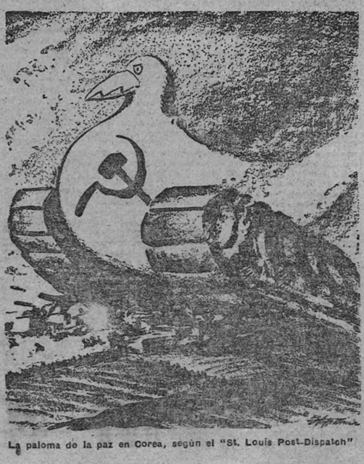
La paloma de la paz en Corea, según el "St. Louis Post-Dispatch"