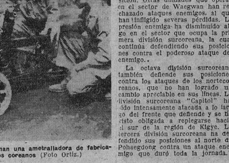
Los soldados norteamericanos examinan una ametralladora de fabricación rusa cogida a los rojos coreanos

TOKIO. — La situación en el frente de Kigye ha empeorado. Un corresponsal de guerra de la agencia Reuter dice que las defensas de