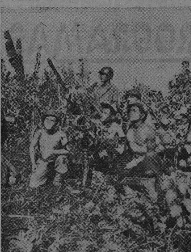
El primer contingente filipino que reforzará a las fuerzas aliadas en Corea, se adiestra en su país. Aquí vemos a los servidores de una máquina anti-aérea haciendo fuego.