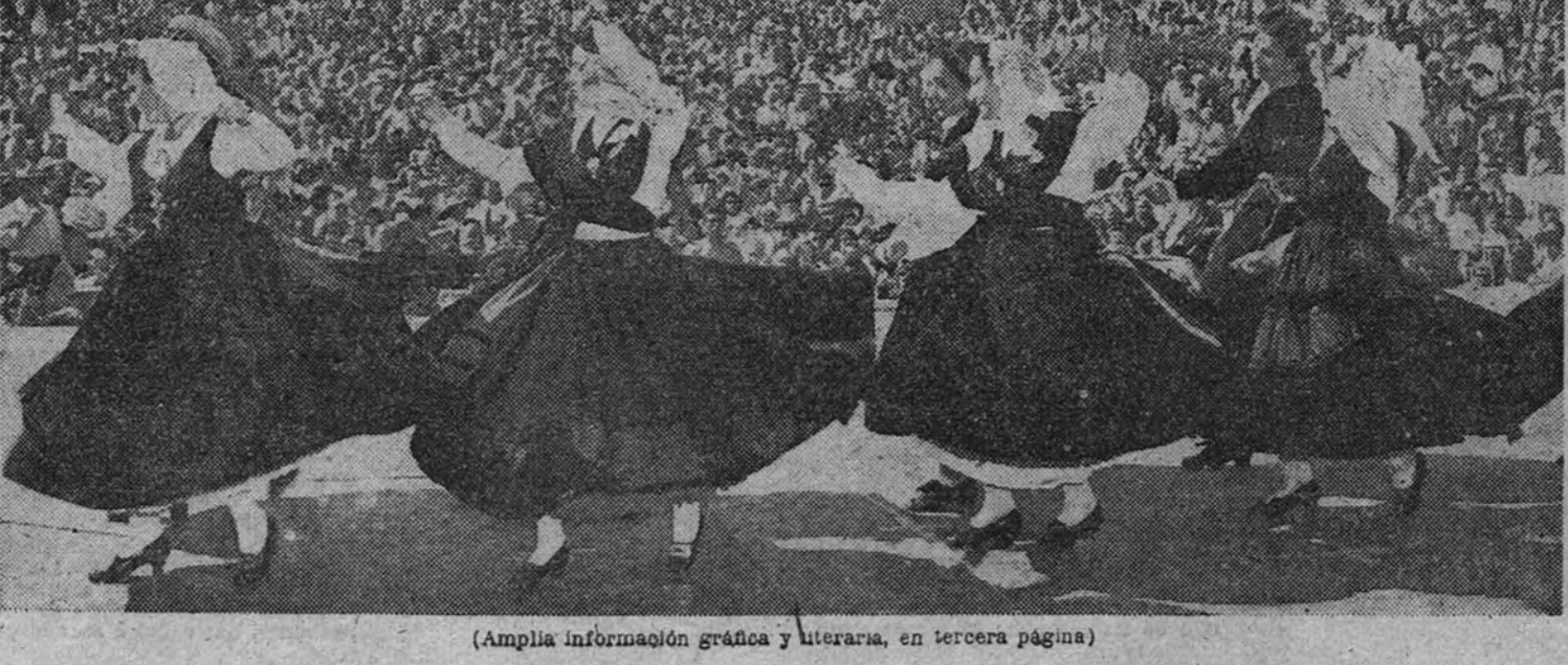
Amplia información gráfica y literaria, en tercera página