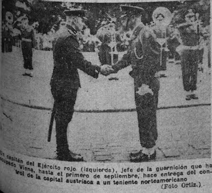
El capitán del Ejército rojo (izquierda), jefe de la guarnición que ha ocupado Viena, hasta el primero de septiembre, hace entrega del control de la capital austriaca a un teniente norteamericano.