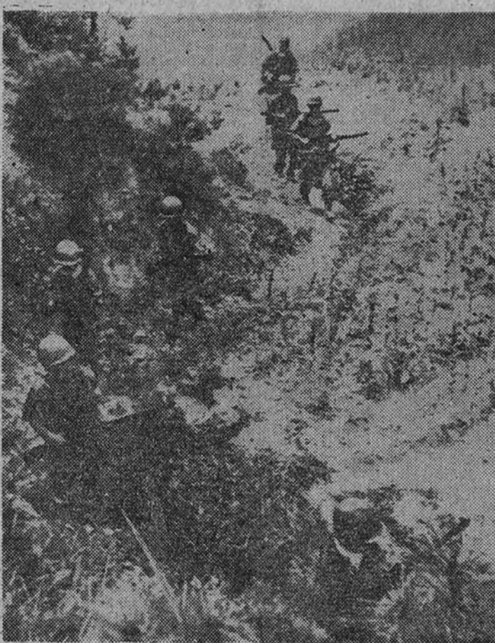
Una patrulla norteamericana en busca de francotiradores en la retaguardia de un sector de combate del frente del río Nakdong