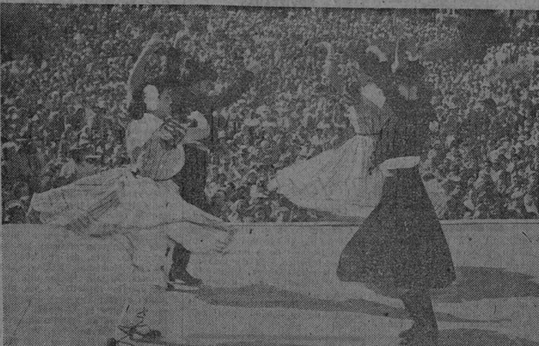
Málaga, en Santa Bárbara

La temporada clásica del Hollywood Bowl se reduce a dos meses: julio y agosto. Sus programas están confeccionados con metódica y puntual anticipación por el estado mayor que comanda el doctor Karl Wecker, director del teatro. Y nadie que no tenga acreditado un éxito constante de primera magnitud puede intentar presentarse ante el público del Bowl. Bien; las chicas de Coros y Danzas actuaron allí en la noche del 24 de agosto de 1950. Eran de Zaragoza, Vigo y Málaga. Nadie les puso pega. Todo lo contrario.