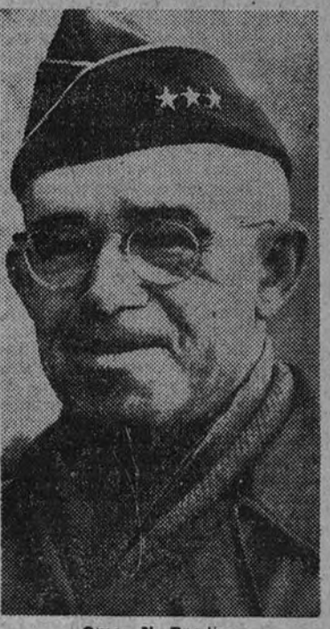
Omar N. Bradley

del Estado Mayor conjunto de las Fuerzas Armadas de los Estados Unidos, general Omar N. Bradley. El senador demócrata Dennis Chavez hizo algunas objeciones, diciendo que aunque se hallaba en favor del proyecto entendía que se aprobaba precipitadamente. El ascenso a general del Ejército con cinco estrellas equivale a nombrarle mariscal. La ley que autoriza el ascenso pasará ahora a la Cámara de Representantes.