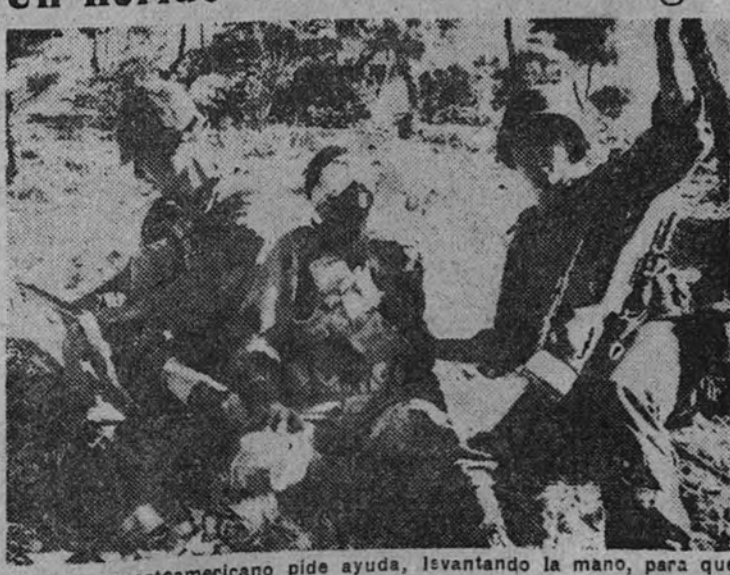
Un soldado norteamericano pide ayuda, levantando la mano, para que acudan en socorro de un camarada gravemente herido en la cabeza, en la misma línea de fuego.