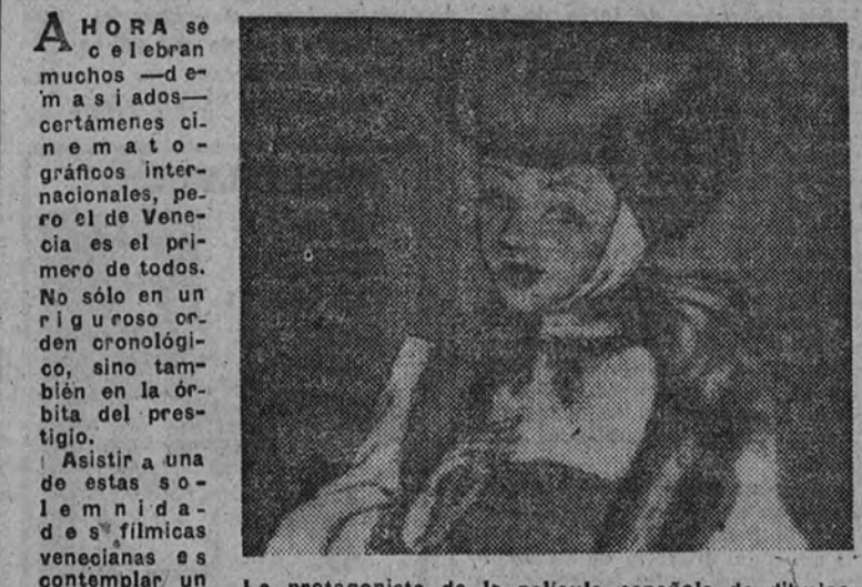
La protagonista de la película española de dibujos en colores "Erase una vez...", basada en el famoso cuento "La Cenicienta", que se ha exhibido fuera de concurso en Venecia