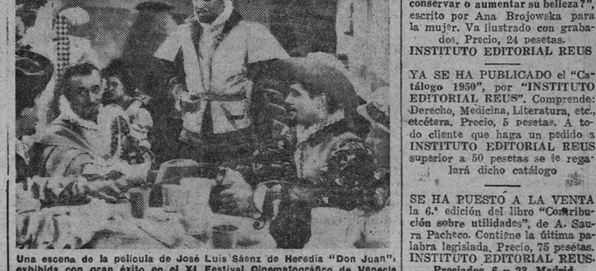
Una escena de la película de José Luis Sáenz de Heredia "Don Juan", exhibida con gran éxito en el XI Festival Cinematográfico de Venecia

Si el no ha triunfado en este festival el cine de México, es porque las películas exhibidas