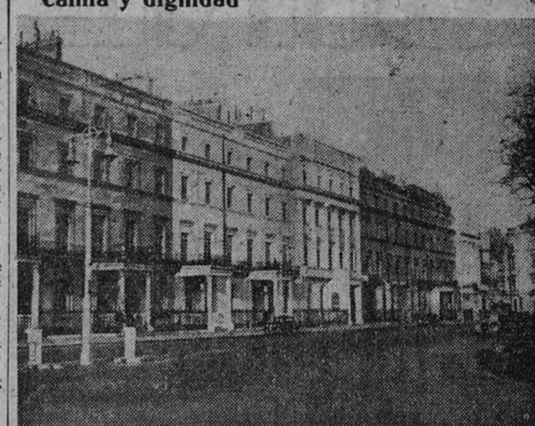
Londres conserva un carácter amable y edificios limpios

Por encima de ella Londres conserva su calma y dignidad