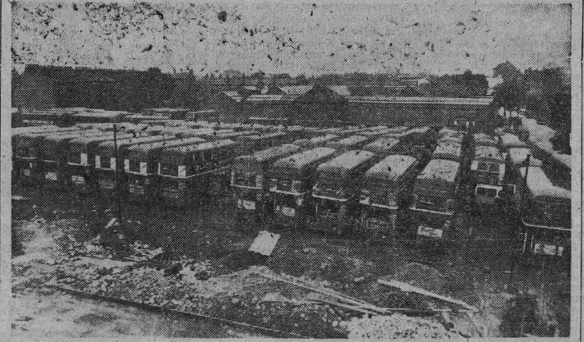
He aquí una cochera repleta de autobuses, ya que sus conductores y cobradores se niegan a trabajar por el hecho de haber sido admitidas tres mujeres para desempeñar los servicios de cobro en las líneas londinenses