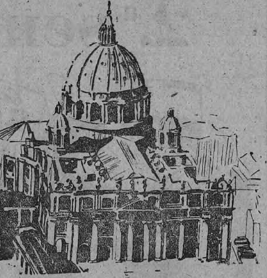
La Basilica de San Pedro