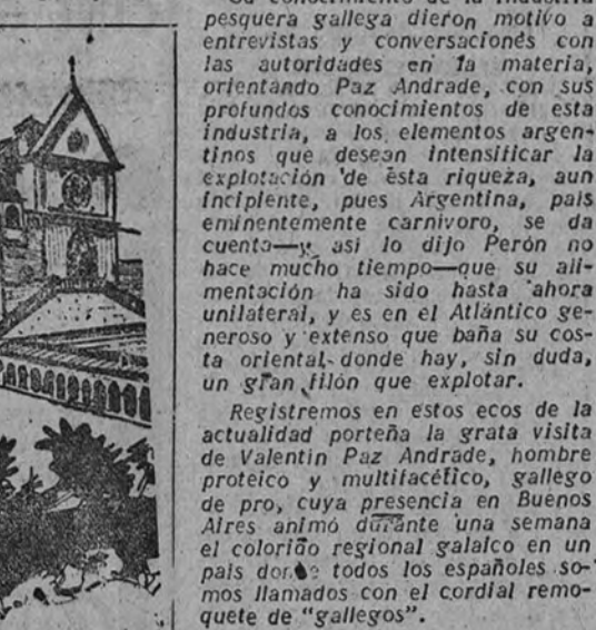
Monasterio de San Francisco, en Asís