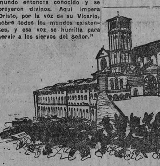
Monasterio de San Francisco, en Asís

En el Teatro Avenida, consagrado tradicionalmente al género español, habló también Paz Andrade, sobre Santiago de Compostela, Galicia y Alfredo Brañas, y en todos los actos y conferencias fue escuchado con vivísima atención. Su conocimiento de la industria pesquera gallega dieron motivo a entrevistas y conversaciones con las autoridades en la materia, orientando Paz Andrade, con sus profundas conocimientos de esta industria, a los elementos gallegos que desean intensificar la explotación de ésta riqueza, aun incipiente, pues Argentina, país eminentemente carnívoro, se da cuenta—y así lo dijo Perón—de que el futuro de su país depende de la explotación de la industria pesquera gallega. Hay contornos sociales que a priori observan y condenan, esas pavorosas y cobardes ojos que miraban vídriamente a Jesús en el tiempo de su obra buena; esos mismos, nos siguen acompañando en casa y por la calle, entre nuestros enemigos, y entre nuestros amigos; ellos constituyen una de las dagas más acoradas que llevan siempre dentro; ellos han desarmado a los espíritus más enteros y,