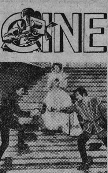
La superproducción Warner Bros. en tecnicolor "El burlador de Castilla", que interpreta Errol Flynn, se estrenará muy pronto, presentada por Procinas.

ALCAZAR. —(212527). Celia Gómez. 7 y 11. Las siete llaves (la revista del esplendor y la alegría). BENAVENTE. —(212584). 7, 11, 11. (La 10.ª edición). El castaño (Manda a su madre a Sevilla; (Pachol-Gómez). CALDERON. —(214353). 7 y 11. Altas Variedades. Nuevo programa. Paqui-Poli, 3 Santa Cruz, Imperio de Triana, Emilio el Moro, Camilla, Luisa, Betas (10 atracciones). Precios populares. (El teatro). COMINO. —(214353). 7 y 11. Torvich. FONTELA. —(Compañía Talía). 7 y 11. 107 y 108 representaciones de Mitos y paisesanos. (Butaca 15 pesetas). FUENCARRAL. —(Compañía Irina). 7 y 11. Molinos de viento y Agua, avistamiento y agitación. (Compañía Irina). INFANTA ISABEL. —(3.ª edición). (Compañía Irina). El cuarto de la verdad. (Compañía Irina). LATINA. —7 y 11. Las auténticas Chavallas de España en Clavetas. (Compañía Irina). LOPE DE VEGA. —(Refinado). (212581). 7 y 11. El Principito Girano con su espectáculo folclórico de España, al cielo de Ochoa. Valero y Solano. MADRID. —(Refinado). 7 y 11. A todo color. (Éxito arrebolado). Butaca, 10 pesetas. PRIME. —(214353). 7 y 11. Ana María González. Don Amor nos faldas. Revista Musical. Pedra Fernández. (Éxito). REINA VICTORIA. —(Compañía Ases). 7 y 11. Gran éxito. (Éxito). REINA VICTORIA. —(Compañía Ases). 7 y 11. Gran éxito. (Éxito). REINA VICTORIA. —(Compañía Ases). 7 y 11. Gran éxito. (Éxito).