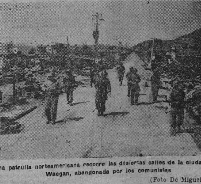
Una patrulla norteamericana recorre las desiertas calles de la ciudad de Waegan, abandonada por los comunistas.