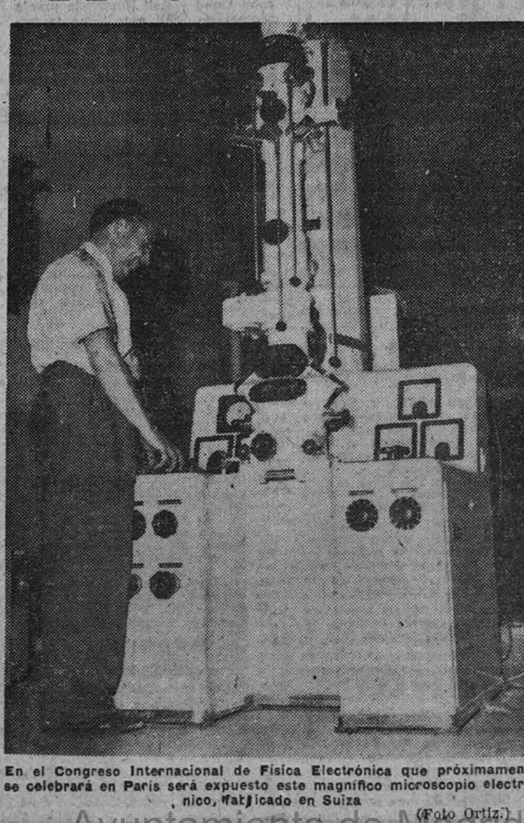
En el Congreso Internacional de Física Electrónica que próximamente se celebrará en París será expuesto este magnífico microscopio electrónico, fabricado en Suiza.