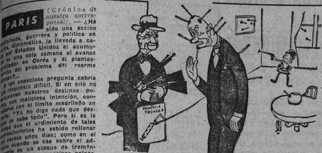
Sea usted amable. Pero me temo que la pequeña no está aún preparada para las armas de verdad. (De "Carrefour".)

Gravísimas suspicacias, serenidad burguesa y poderosa fuerza