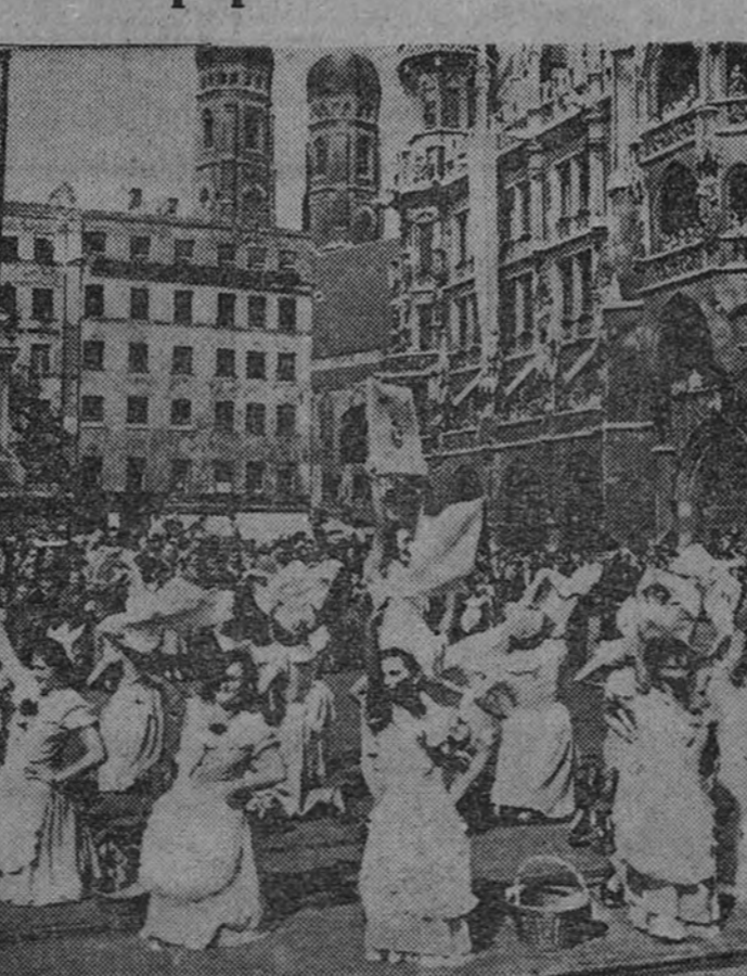
Munich, durante la celebración de las tradicionales fiestas en Munich, interpretan el «bailo de las lavanderas» al pie de la catedral