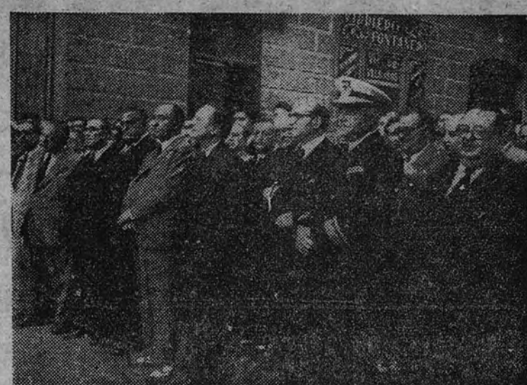
El Ministro de Justicia y Secretario General, el de Educación Nacional y otras personalidades, en la presidencia del duelo

El Claustro de profesores y los alumnos de la Facultad de Medicina rindieron homenaje al ilustre hombre de ciencia