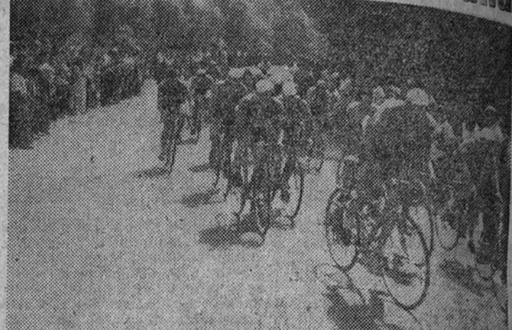
El pelotón de cabeza de la XXX Vuelta Ciclista a Cataluña llega a Montjuich