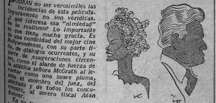
Katherine Hepburn y Spencer Tracy

PODRAN no ser verosímiles las incidencias de esta película. Seguramente no son verídicas. ¿Y qué importa? Lo importante es que tiene mucha gracia. Es una comedia del mejor cine norteamericano, con su parte fina, de diálogos ocultos, y su parte de exageraciones circulares, como el alarde de fuerza de la atleta señora McGrath al levantar con una suave pluma, afectado, y de todos los concurrentes, al severo fiscal Adán Bonner.