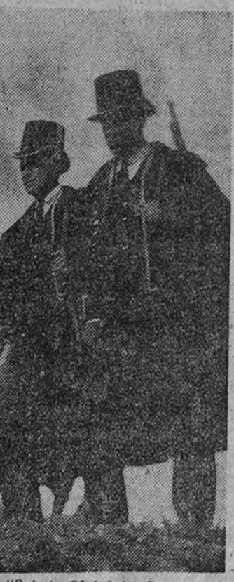
El “Boletín Oficial del Estado” publica, entre otras, la siguiente disposición.

Considerados de nueva creación, tendrán carácter militar