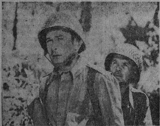
Errol Flynn en "Objetivo: Birmania". Esta nueva superproducción Warner Bros. ante la que existe una gran expectativa, se estrenará el lunes en la pantalla del Capitol.