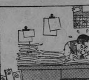
COMODAS CUOTAS MENSUALES