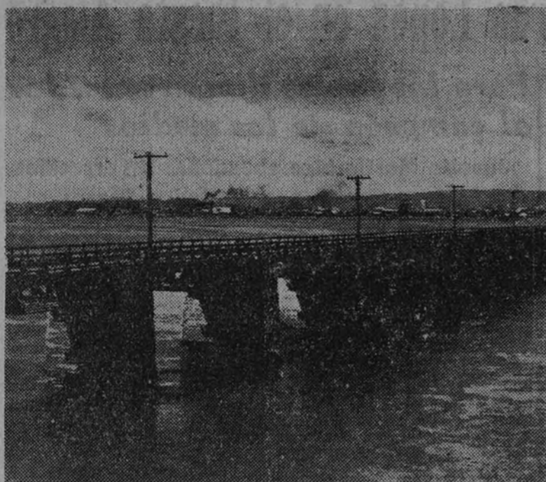
Puente carretero Bio-Bio, en Concepción

LA CONCEPCION (Chile).—Ciento cincuenta y ocho páginas de gran tamaño dedicadas a exaltar los diversos aspectos de la historia de la fundación de la ciudad por los españoles, publica el diario "El Sur". En este número extraordinario se recogen los trabajos de ilustrados investigadores, en los que se enumeran los primeros vecinos de la ciudad y las circunstancias que rodearon su instalación en la misma, en una lucha constante contra los araucanos, que ha durado hasta mediados del siglo XIX. En términos rebozantes de afecto y de gratitud se describe la actuación del fundador Pedro de Valdivia, considerado como el más noble, justo y valeroso de los conquistadores españoles, exento por completo de codicia. Se subraya que siendo Val-