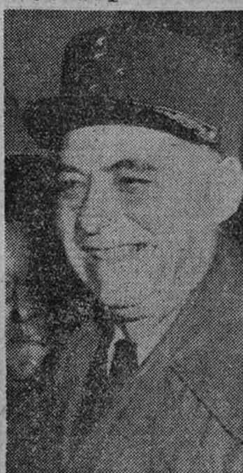
El general Juin

A las ocho y media saldrá del Palacio Vaticano el cortejo papal. A las nueve llegará al trono el Sumo Pontífice, que en él recibirá la obediencia de los cardenales y contestará personalmente a la petición de proclamación del Dogma. A continuación se cantará el "Veni Creator" y seguirá la penetrante Pío XII en la Basilica para explicar el solemne pontifical, al término del cual volverá al Palacio a través de la plaza de San Pedro. (Efe.)