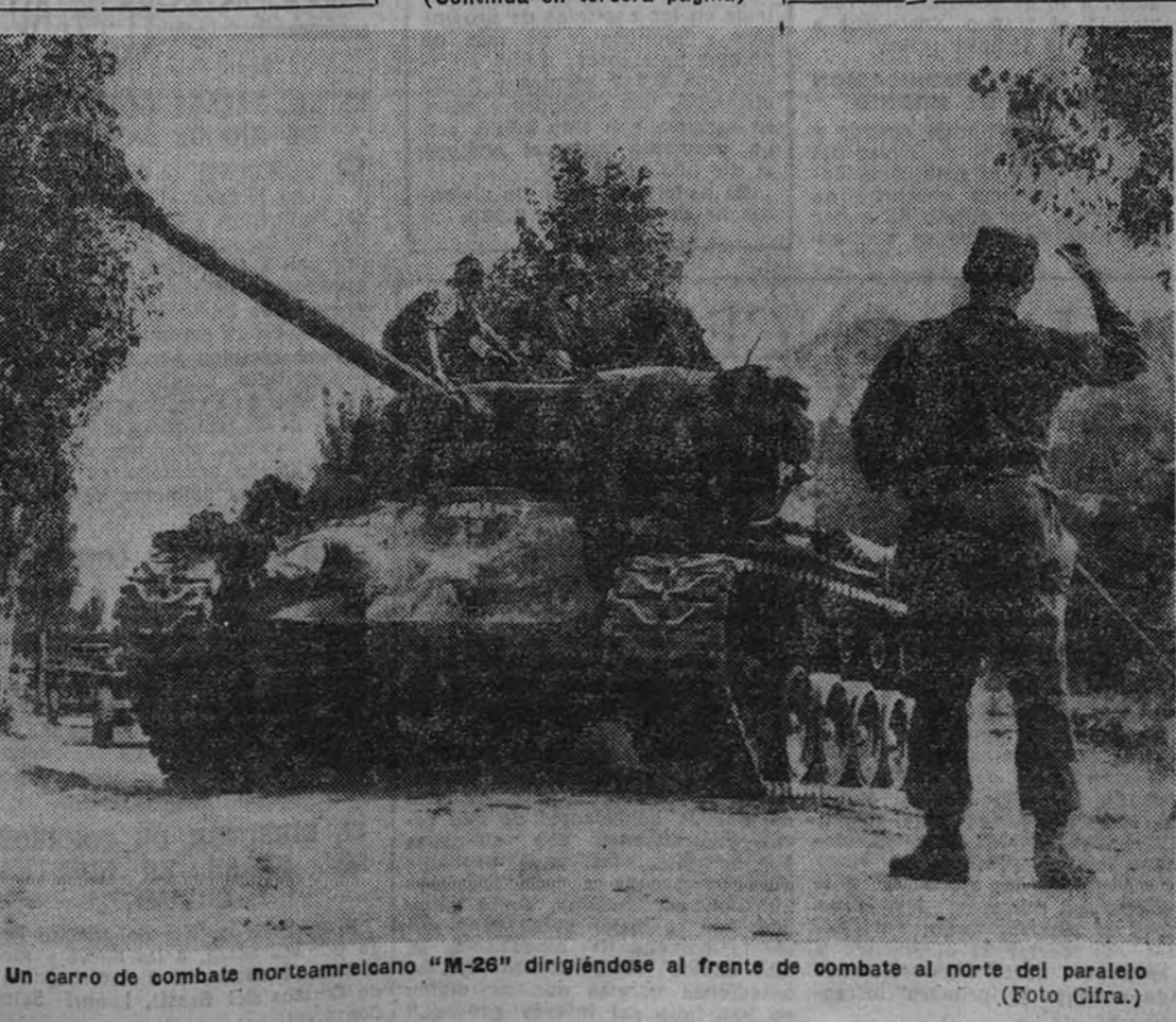
Un carro de combate norteamericano "M-26" dirigiéndose al frente de combate al norte del paralelo