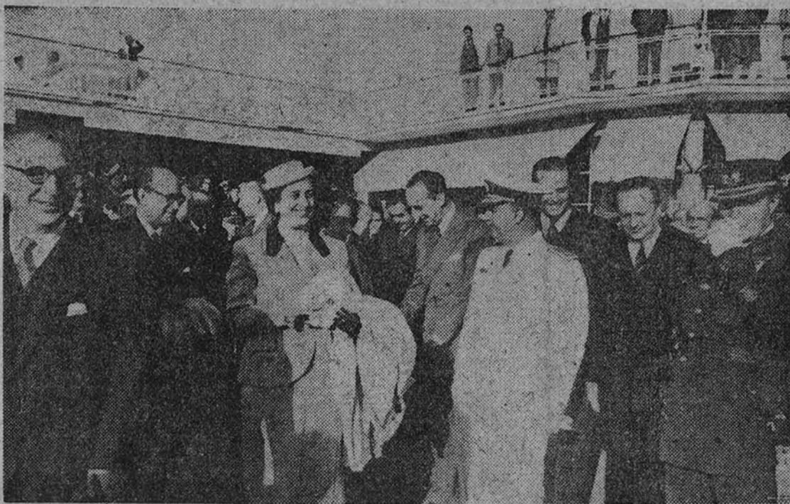
El Caudillo, con su esposa, el Gobierno y otras personalidades, en el aeropuerto de Barajas, momentos antes de partir para África

En esas tierras africanas que hoy visita nuestro Caudillo, pendientes tan a menudo del recelo exterior y la incuria interior de los tiempos inmediatamente pasados, es donde el hombre que hoy nos gobierna alcanzó, como una visión providencialmente clara, el destino y la sazón española. La figura de Franco es una figura cuyas líneas costaría mucho trabajo poder explicar sin la vasta y humilde, sin la sangrante y pacífica presencia de África. Es muy probable que la historia española, más agradecida de lo que comúnmente suele creerse, nos reserve la que para muchos sería reveladora sorpresa: la contrapartida de que un día próximo tampoco pueda explicarse la pacífica y construida presencia de África sin la figura de Francisco Franco.