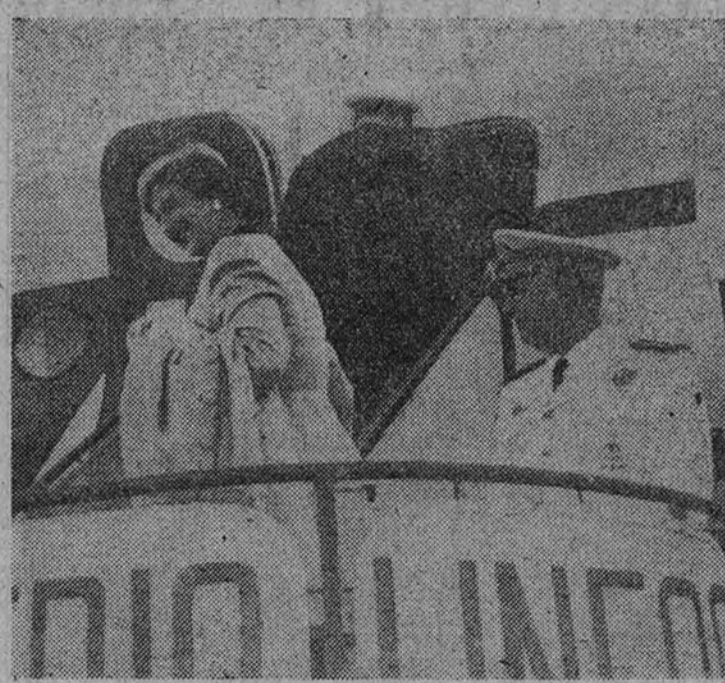
El Caudillo y su esposa, subiendo al avión que los condujo a África