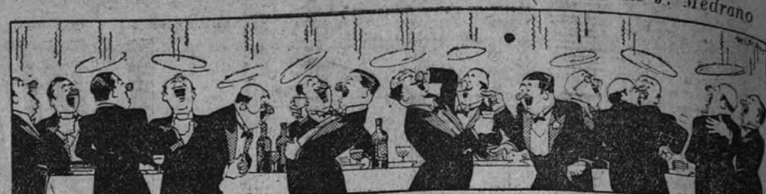
VINO DE HONOR