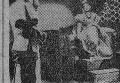
Escena de "Don Juan" con sus principales intérpretes, Antonio Vilar y Annabella. "Don Juan" se exhibe en tercera semana de gran éxito en el cine Avenida

"La Belleza del Diablo" será presentada por Cifesa, a la que el público español debe el haberse deleitado y emocionado con "El tercer hombre".