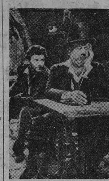
Fotograma de la realización de René Clair "La Belleza del Diablo", que presentará Cifesa. En el aparecen Gerard Philippe y el gran actor "La Belleza del Diablo", DE RENE CLAIR

Cuando terminó el estreno de "La Belleza del Diablo" en París, el crítico de "France-Soir" salió al encuentro de René Clair y le saludó "con un largo golpe de sombrero", reverencia inequívoca de admiración entusiasta. En efecto, René Clair había logrado su mayor triunfo de gran realizador.