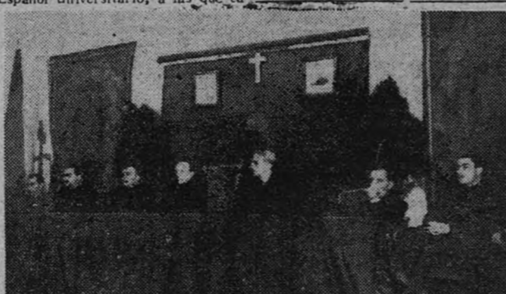
La presidencia de la apertura de curso

PARTICIPA a sus asegurados y público en general que el funeral que se celebrará en San Francisco el Grande hoy, día 1, a las diez de la mañana, así como la misa que se diga a las doce en la capilla del cementerio de Nuestra Señora de la Almudena (cementerio del Este) y las que se anuncien en las respectivas parroquias de Alcobendas, San Sebastián de los Reyes, Fuencarral, Villaverde Alto, Vallecas, Vicalvaro, Colmenar Viejo, El Pardo, Pozuelo, Majadahonda, Las Rozas, Barajas, El Escorial Alto, Miraflores de la Sierra, Villalba-Estación y San Martín de Valdeiglesias, serán aplicadas en sufragio por las almas de sus asegurados fallecidos.