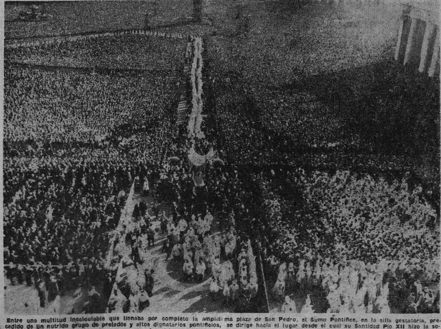
Entre una multitud inabarcable que llenaba por completo la amplísima plaza de San Pedro, el Sumo Pontífice, en la silla gestatoria, precedido de un nutrido grupo de prelados y altos dignatarios pontificios, se dirige hacia el lugar desde el cual su Santidad Pío XII hizo la solemnisima proclamación del dogma asuncionista