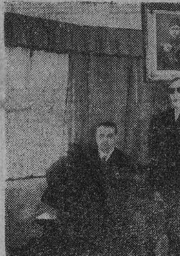
El ministro de Educación Nacional de Egipto, con los señores Ibáñez Martín y Martín Artajo, durante el solemne acto de inauguración del Instituto de Egipto en España.

El ministro egipcio comenzó dirigiendo un saludo a España en re-