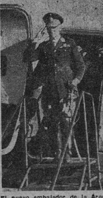
El nuevo embajador de la Argentina, general Oscar R. Silva, al descender del avión en que hizo el viaje desde Lisboa a nuestra capital.