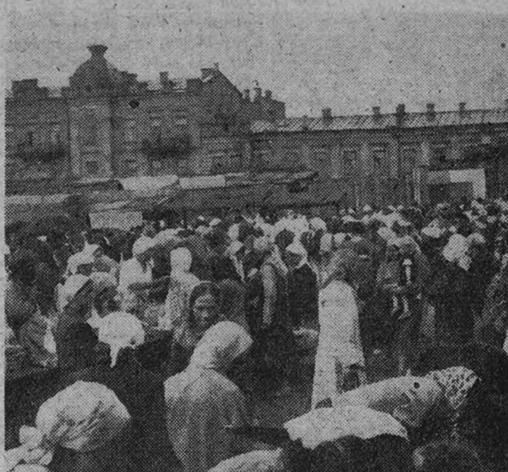
En un mercado moscovita un grupo de mujeres hace sus compras. En su aspecto exterior se refleja el bajo nivel de vida de la mujer rusa

sado sensación al yo me hubiera casado con un norteamericano; pensaría un inglés el que se casó conmigo y esto ya no es sensacional para los Estados Unidos.