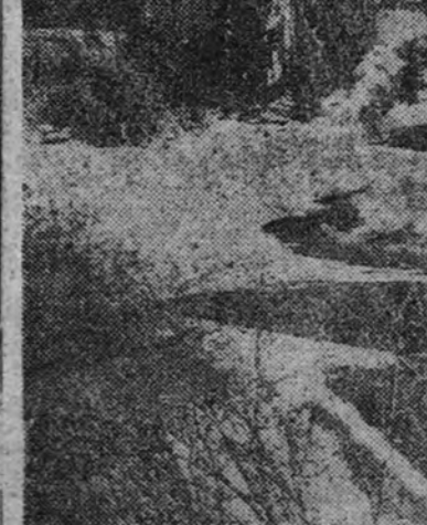
El Valle del Sol, en Idaho (Estados Unidos) es el lugar de esparcimiento más afamado del país. Continuamente llegan autobuses cargados de gentes que van a disfrutar de unos días de vida campesina y deportiva junto a la nieve de las montañas