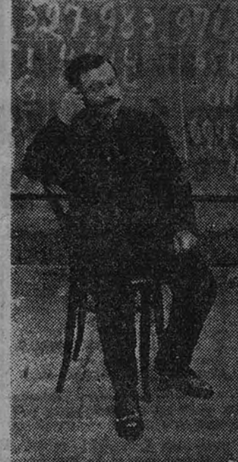
PARÍS. — El célebre calcula- Jacquès Inaudi, conocido mundial- mente por sus exhibiciones en circos y teatros, ha fallecido a los ochenta y tres años, en su residencia en la alrededores de esta capital.

Inaudi nació el 16 de octubre de 1867 en Roccafranca, en Piamonte (Italia); pero se naturalizó francés a la edad de quince años. Desde entonces se mostró capaz de efectuar con una rapidez prodigiosa los cálculos más complicados. En 1901, en los Estados Unidos batió la velocidad de muchas máquinas de calcular. Estaba retirado de sus exhibiciones desde 1934. (Efe).