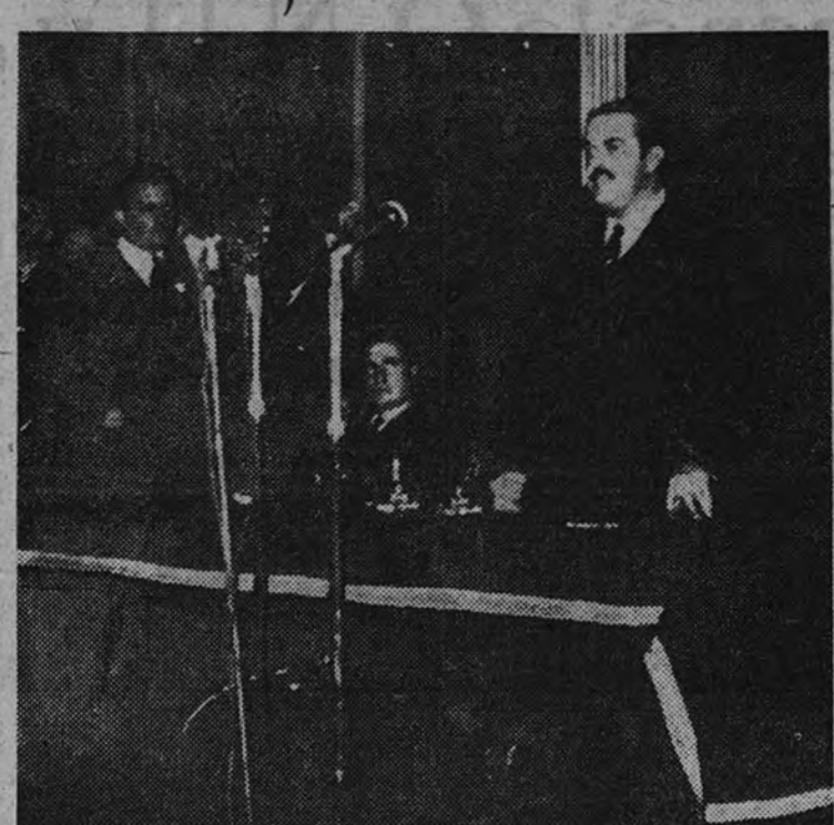
El Ministro de Trabajo, camarada José Antonio Girón, durante la importante conferencia que pronunció en la Cámara de Comercio de Sevilla sobre la cultura y la política social.