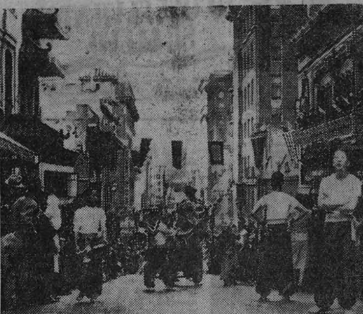
En una calle del barrio chino de San Francisco se celebra un típico desfile, en el que se pasea el león de Buda en sustitución del tradicional dragón

proporciona el 75 por 100 de su tipo al barrio chino no puede disminuir la existencia de una realidad más sólida que los bazares para turistas en manada y los tipos patibularios o que, por estar allí, parecen patibularios. Me refiero a la realidad de 12.000 chinos, que, sin embargo, quedan muy por debajo de los griegos, checos, polacos, irlandeses, alemanes, rusos, italianos y judíos, que se apiñan con los representantes de otras 70 naciones en la más densa concentración urbana que ha conocido la humanidad. Con sus 200 periódicos en idiomas distintos del inglés, Nueva York, ciudad levantina, poliglota y mercantil, es una perfecta antipación de América.