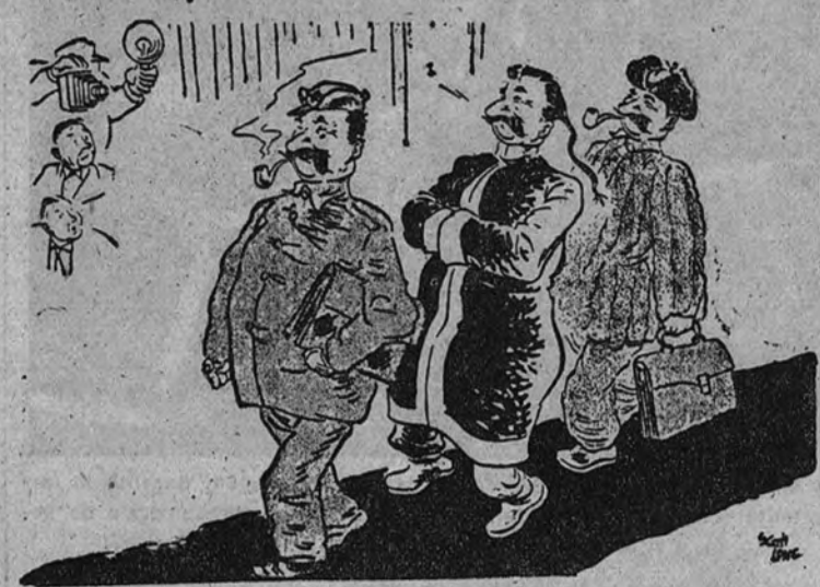
Ha llegado a los Estados Unidos la Delegación de la China comunista ("The New York Times").

LAKE SUCCESS.—Poco después de las tres de la tarde se reunió el Consejo de Seguridad para continuar el debate sobre Formosa.