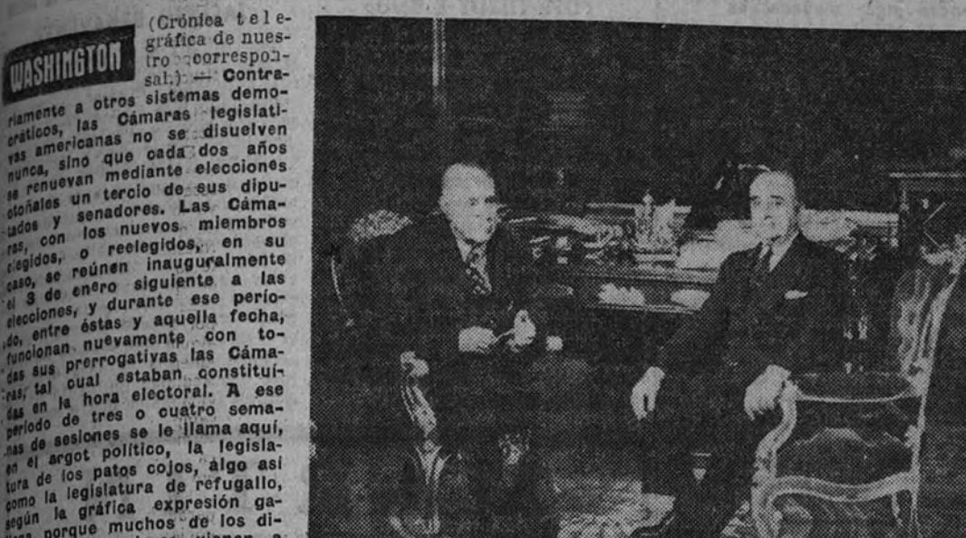
Esta fotografía cobra ahora actualidad. Fue hecha cuando Mac Cormick, propietario del influyente "Chicago Daily Tribune", visitó en el palacio de El Pardo a su Excelencia el jefe del Estado, Mac Cormick ha sido uno de los más decididos propagandistas de una política de amistad entre Norteamérica y España.

Se entra en la fase de los "patos cojos"