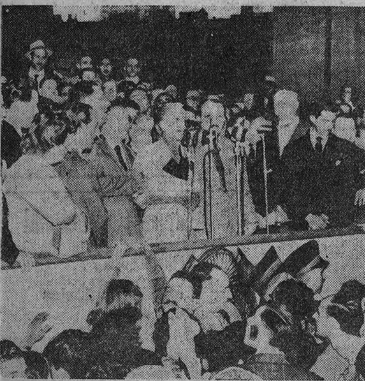
Eva Duarte de Perón habla al pueblo de Buenos Aires con motivo del séptimo aniversario del ministerio de Trabajo y Seguridad Social, fundado por el Presidente Perón en 1943.