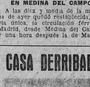
El temporal de aguas en Francia ha hundido una casa—levantada en el mismo corazón de Limoges—, al remover el subsuelo, muy poco resistente por los numerosos subterráneos medievales que existen bajo la plaza de los Bancos. No hubo desgracias personales.

A las diez y media de la mañana de ayer quedó restablecida, por vía única, la circulación férrea de Madrid, desde Medina del Campo, y una hora después la de Madrid.