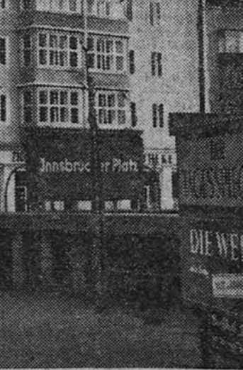
En la plaza de Insbrucker, en el Berlín occidental, ha sido inaugurado un bloque de viviendas de ocho pisos. Se trata de la casa más alta de la ciudad, y en ella vivirán veinticinco familias.