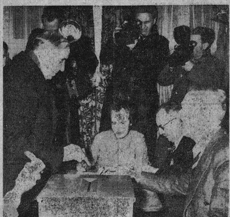
Los alemanes residentes en el sector occidental de Berlín acudieron el domingo a las urnas en un elevado porcentaje para emitir su voto. He aquí al profesor Ernst Reuter, jefe del Gobierno socialista de la ciudad, depositando su papeleta electoral en uno de los colegios.