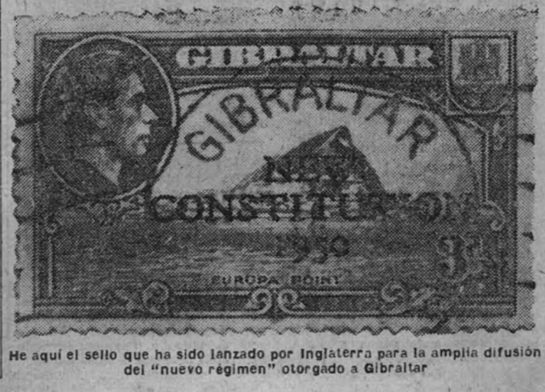
He aquí el sello que ha sido lanzado por Inglaterra para la amplia difusión del "nuevo régimen" otorgado a Gibraltar