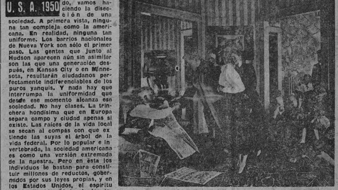
Gracias al seguro y al crédito el hogar americano suele ser acogedor

Burla burlando, vamos haciendo la disección de una sociedad. A primera vista, ninguna tan completa como la americana. En realidad, vivimos en una sociedad de Nueva York no sólo el primer paso. Las gentes que junto al Hudson aparecen aún sin asimilarse son las que una generación después, en Kansas City o en Minnesota, resultarán ciudadanos perfectamente indistinguibles de los puros yanquis. Y nada hay que interrumpa la uniformidad que desde ese momento alcanza esa sociedad. No hay clases. La trinchera hondísima que en Europa separa campo a campo a los individuos se desdibaja en la vida local se secan al compás con que extiende las suyas el árbol de la vida federal. Por lo popular e invertebrada, la sociedad americana es como una versión extremada de la nuestra. Pero en esta sociedad se bastan para constituir millones de reducidos, gobernados por sus leyes propias, y en los Estados Unidos, el espíritu cooperativo heredado de los ingleses y la nivelación de los gustos, de las necesidades y de los medios de satisfacerlas, permiten el desarrollo de un fermento individualista semejante al nuestro.