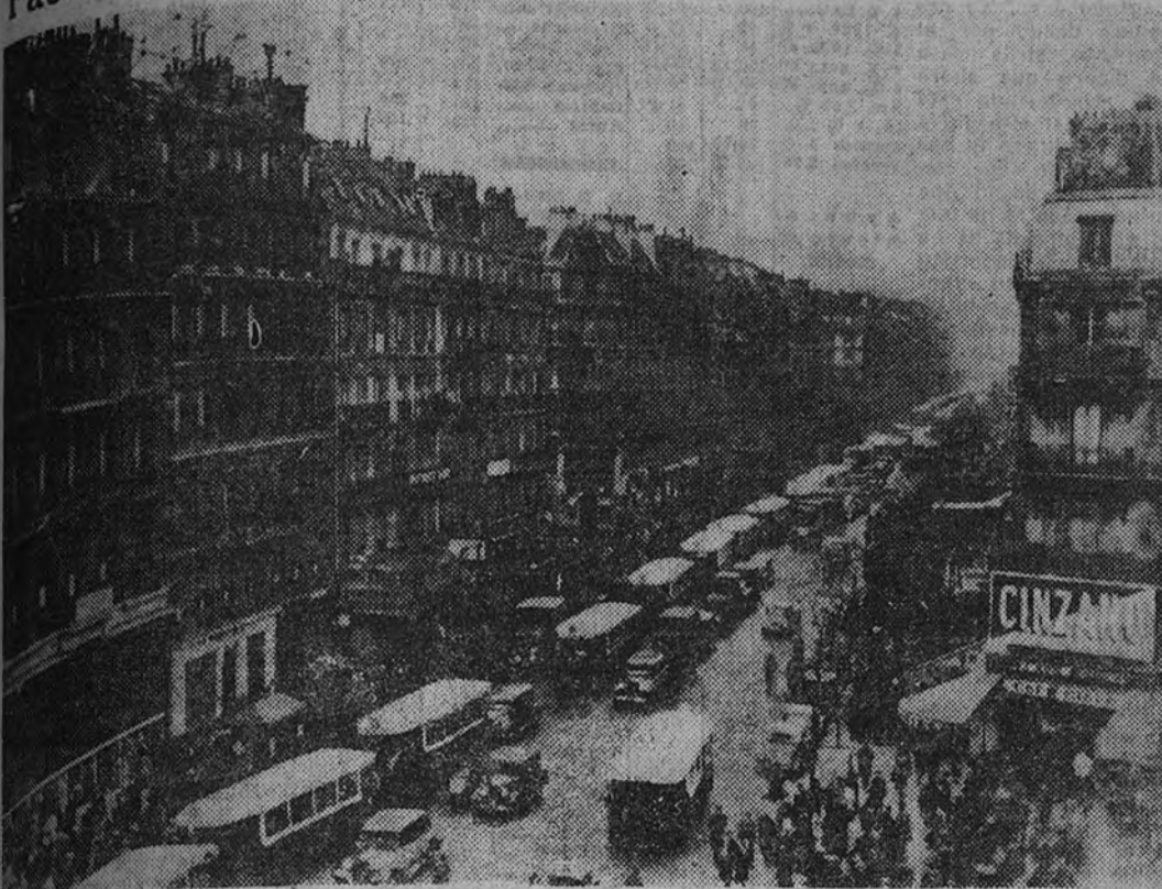
Una de las arterias donde la vida comercial de París late con mayor intensidad es el Boulevard Magenta, cuya confluencia con la no menos activa rue Lafayette reproduce nuestra fotografía. Al fondo, la Lussitana del Sacre Coeur, de Montmartre

Apasiona a sus habitantes la pugna formidable entre sus grandes almacenes Vestidos, joyas, perfumes y chacinería para las Pascuas, maravillas de los escaparates