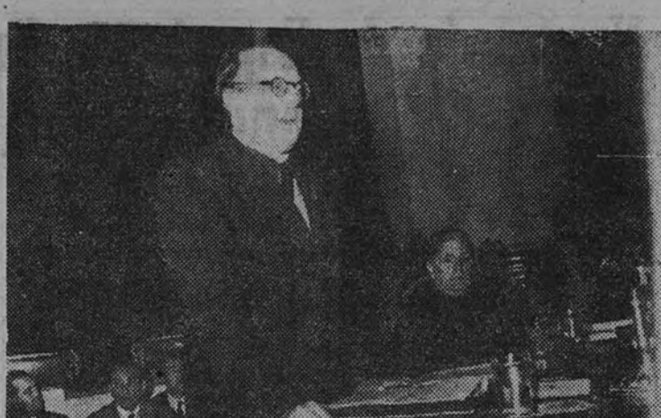
El Delegado Nacional de Sindicatos durante su intervención en el acto de clausura del Pleno del Consejo Económico Sindical.

La Organización Sindical hemos de robustecerla y fortificarla en interés de la comunidad española, por ser la medula social y económica del Movimiento. Cuanto la debilita contribuye a hacer a éste más endeble; por eso hemos de evitar los ataques directos y los indirectos, y por eso las victorias que sobre ella se puedan obtener a la larga se convertirán en perjuicio para los que ordenan y hacen las cosas. (Muy bien. Grandes aplausos.)