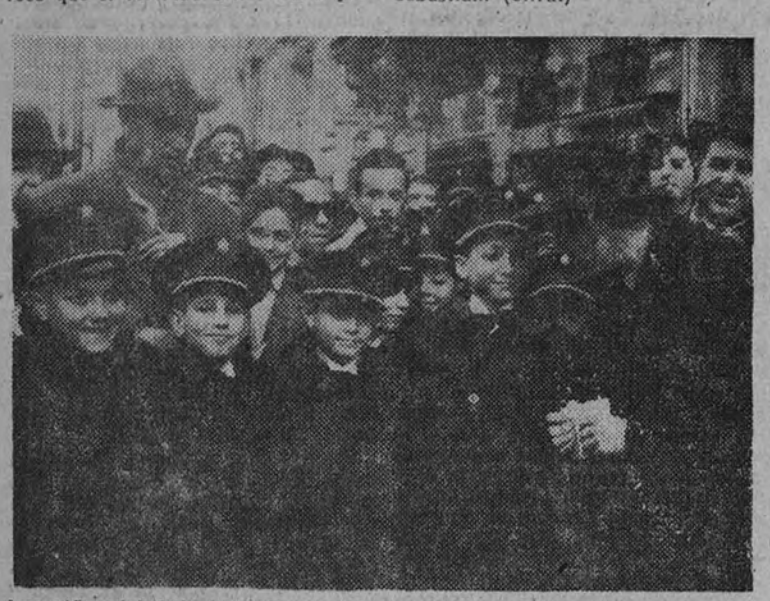
Los niños del Colegio de San Ildefonso que cantaron el premio "gordo" en el sorteo de ayer