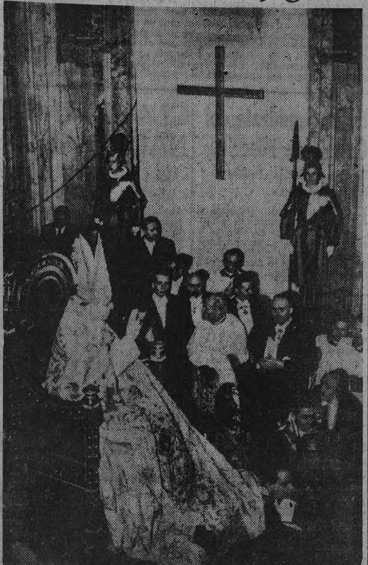
Su Santidad el Papa durante la solemne ceremonia del cierre de la Puerta Santa, con cuyo acto queda clausurado el Año Jubilar de 1950.

El Papa se pone en pie en el trono, luego de haberle sido quitada la mitra, para recitar las oraciones con que va a concluir la ceremonia. Este "oremus" dice así: "Oh, Dios, que por donde se extiende tu dominio eres deidad de bendición, haz que la Puerta Santa, que este lugar este invulnerable y que todos los fieles se alegren de haber impetrado en este Año Jubilar los beneficios de la Puerta Santa".