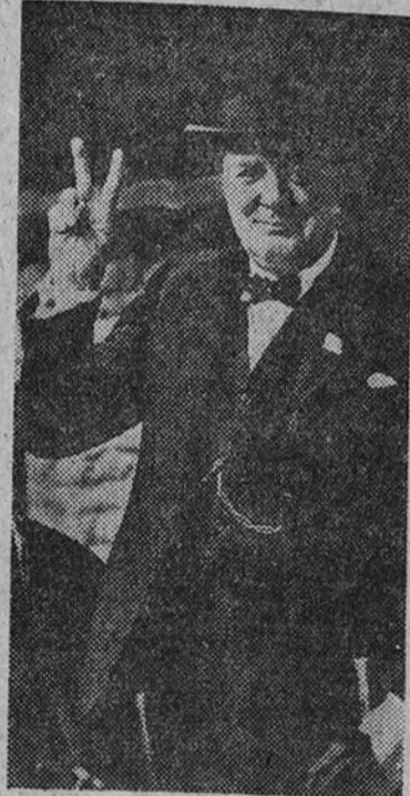
Tras la triunfante "v" se esconde una española derrota

LONDRES. (Crónica de nuestro corresponsal). Cuando Winston Churchill, el hombre más poderoso del mundo, se despierta a las ocho de la mañana, los londinenses empezaron a salir de sus casas. Si el "reloj-despertador-tetera" que se vende en las tiendas de la "v" antes de las ocho de la mañana, los londinenses empezaron a salir de sus casas. Si el "reloj-despertador-tetera" que se vende en las tiendas de la "v" antes de las ocho de la mañana, los londinenses empezaron a salir de sus casas.