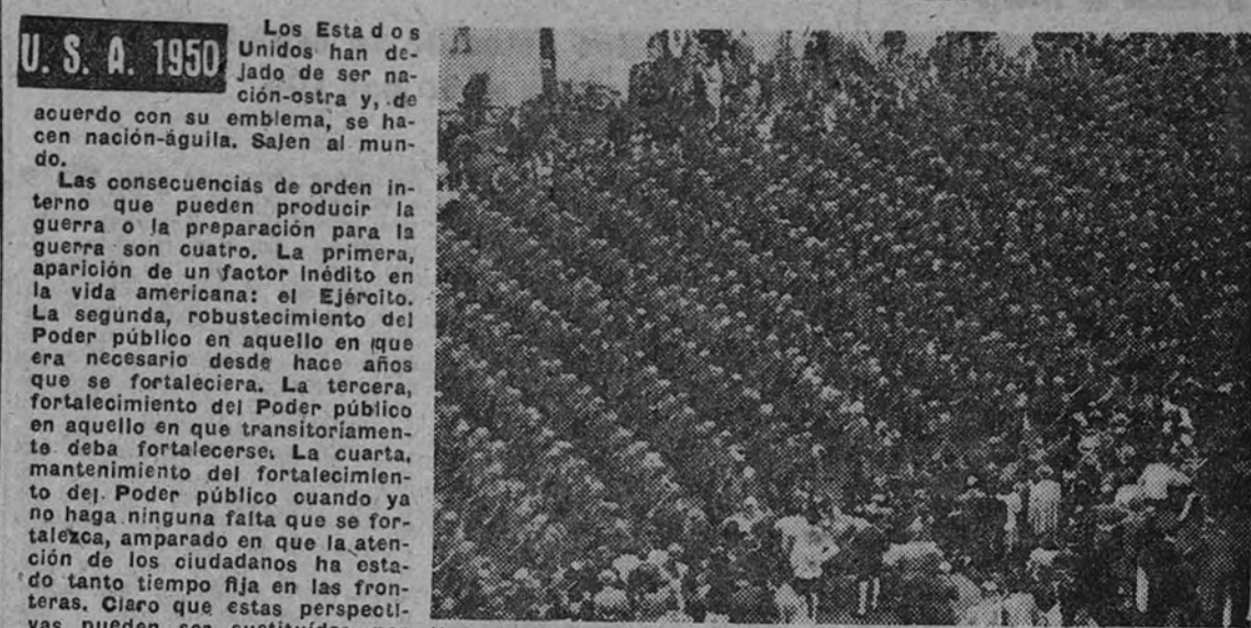
Hoy por hoy, los Estados Unidos necesitan el buen sentido que sus militares han representado en el mundo

Los Estados Unidos han dejado de ser nación-ostrea y, de acuerdo con su emblema, se hacen nación-aguila. Salen al mundo. Las consecuencias de orden interno que pueden producir la guerra o la preparación para la guerra son cuantiosas. La primera, la aparición de un factor inédito en la vida americana: el Ejército. La segunda, el fortalecimiento del Poder público en aquellos en que era necesario desde hace años que se fortaleciera. La tercera, el fortalecimiento del Poder público en aquellos en que era necesario que se fortaleciera. La cuarta, el fortalecimiento del Poder público en aquellos en que era necesario que se fortaleciera.