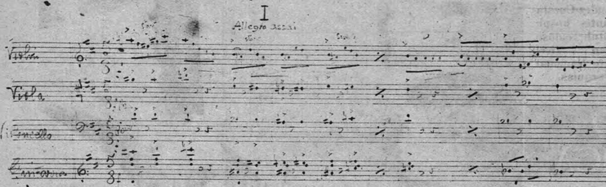
Borrador de los primeros compases del «Cuarteto en Re» para violín, viola, violoncello y guitarra.

timulante para nuestra labor. Ya en 1923 conseguí un primer accésit en el Concurso Nacional. Se trataba de unas canciones sobre poemas de Heine.