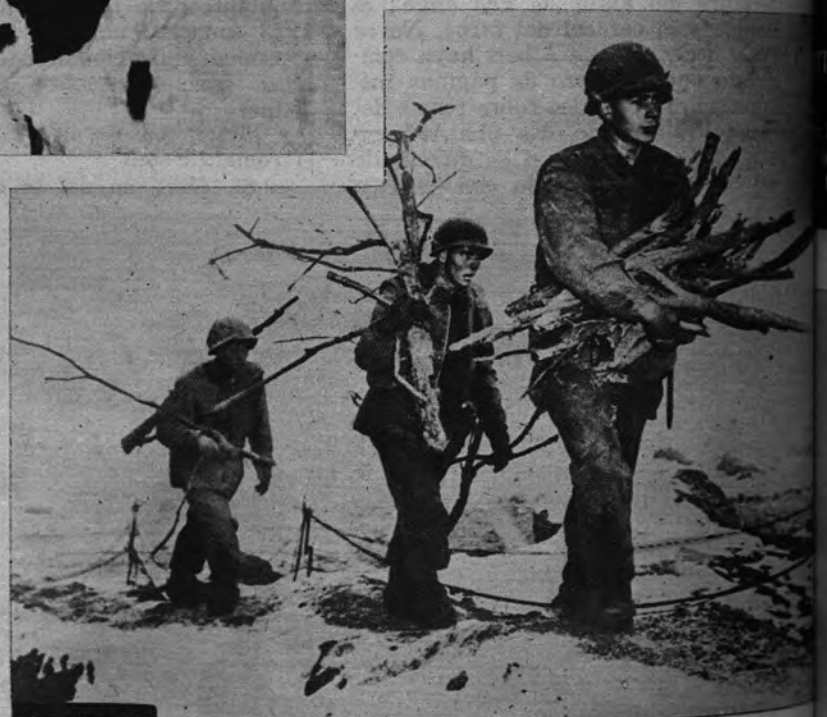
LEÑA EN COREA. —Es demasiado fácil el título de esta foto, pero también es cierto que los primeros en gastarse la broma habrán sido los propios soldados que tratan de «capaciguar» el tremendo frío coreano con la leña que facilitan los bosques calcinados.