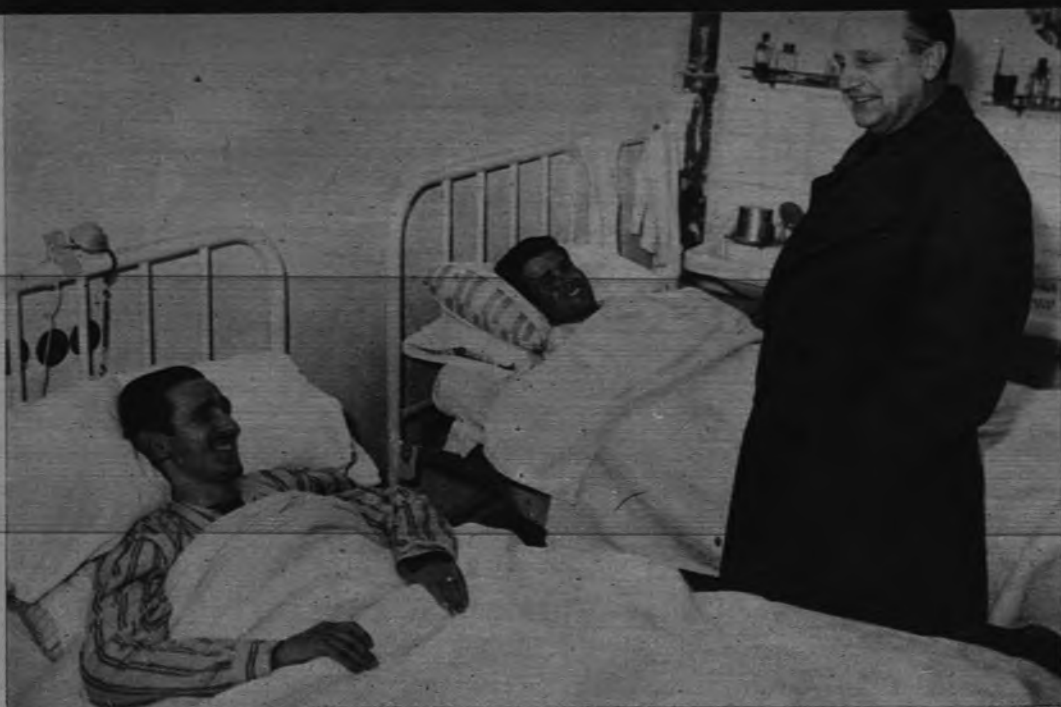
EL SECRETARIO GENERAL, EN ALCOHETE. —Raimundo Fernández-Cuesta visitó a los noventa estudiantes hospitalizados en el sanatorio antituberculoso de Alcohete. Le acompañaron el Vice-secretario de Secciones, el Jefe Nacional del S. E. U. y otras jerarquías.