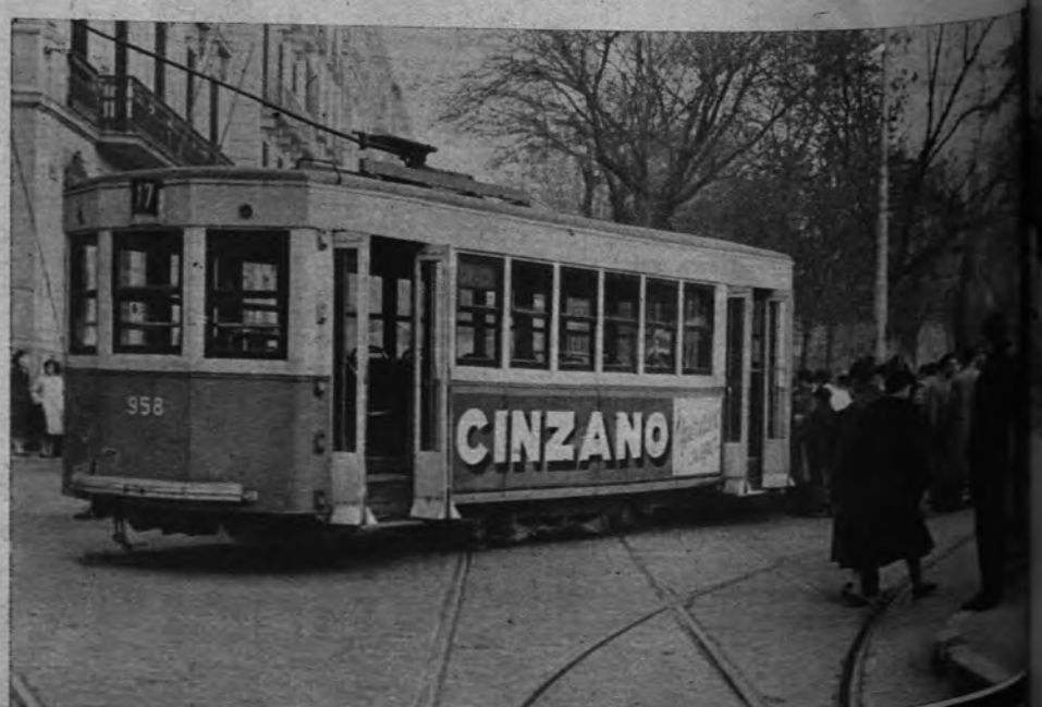
TRANVIA CONTRA TURISMO. —Gracias a la habilidosa maniobra de su conductor, este tranvía no fué a parar al andén de Recoletos, aunque se ab...