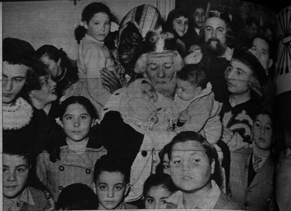
LOS REYES, EN PRENSA GRAFICA. Por segunda vez desde el comienzo de la Navidad, y justamente para cerrar con arreglo a las normas de una camaradería, la gerencia de Prensa Grafica, de la Delegación Nacional del movimiento, ha reunido en su torno a todos los productores que en ella trabajan, acompañados de sus familias. Los Reyes Magos hicieron una espectacular entrada y un espléndido reparto de regalos y de alegría entre los muchos niños que allí les esperaban. Además, los Santos Monarcas abrieron libreta de ahorro por valor de 25 pesetas a cada uno de los hijos de los productores de la Empresa.