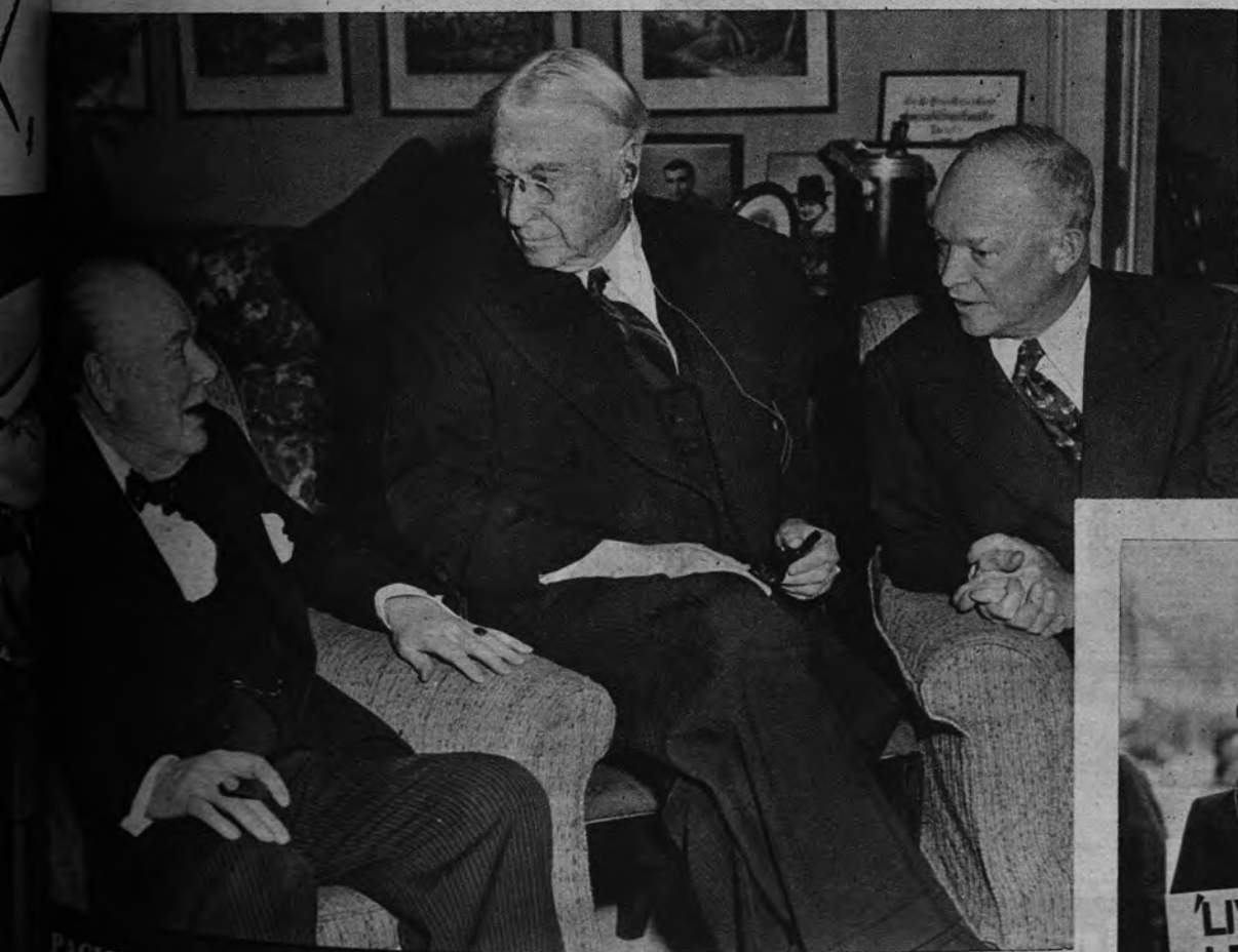
PACIGUANDO El «premier» británico, Mr. Winston Churchill, conversa con el Presidente de los Estados Unidos, general Eisenhower. La conversación transcurre en el domicilio del vicepresidente, Bernard Baruch, que aparece en el centro de la fotografía. Como Mr. Churchill intenta suavizar la política de la Administración republicana respecto a los pacifistas del Kremlin.