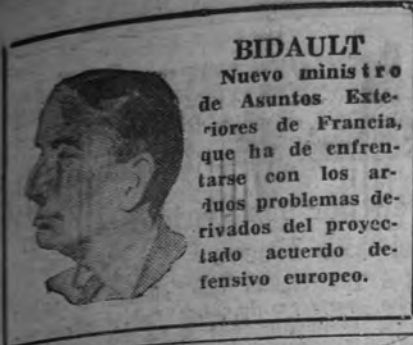
BIDAULT Nuevo ministro de Asuntos Exte- riores de Francia, que ha de enfren- tarse con los ar- duos problemas de- rivados del proyec- tado acuerdo de- fensivo europeo.