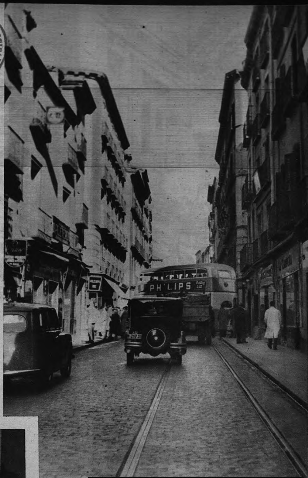
MANIOBRA ANTE EL SOCAVON La calle de Hortaleza, vieja calle de Madrid que soporta un tráfico intensivo, ha registrado un nuevo socavón del subsuelo. El servicio de autobuses, como el resto de la circulación rodada, tiene que desviarse por la calle de Augusto Figueroa. Esta desviación obliga a los grandes autobuses de la Empresa Municipal de Transportes a verificar una complicada maniobra, de la que da idea la fotografía, en la que puede compararse la largura del vehículo con la anchura de la calle.