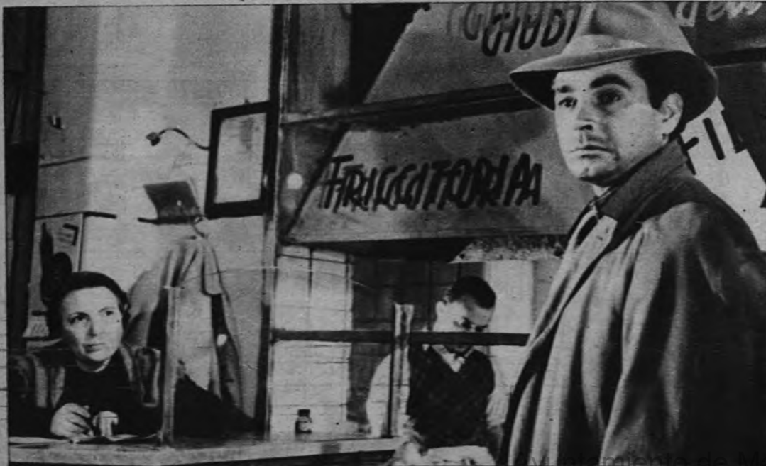
Renato Baldini vuelve a emocionarnos memorablemente con su magnífica actuación en «La ciudad se defiende».

Cifesa presenta en España este film, destinado a obtener aquí el mismo extraordinario éxito que consiguió en Italia, que refrendó el galardón de la Bienal de Venecia, y que alcanzó en otros países, por su interés, por su interpretación, por su dirección y por su misma calidad.—B.