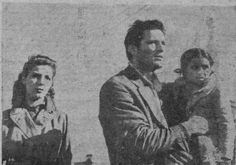
El próximo estreno de Rialto será «La ciudad se defiende», un film neorrealista italiano interpretado por Gina Lollobrigida y Renato Baldini, triunfador en la Bienal de Venecia