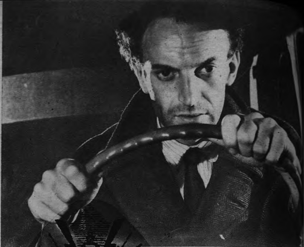
Paul Muller, uno de los mejores actores del cine europeo, consagra nueva y plenamente en «La ciudad se defiende».