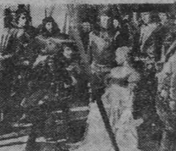
«Othello», presentado por Cifesa, llena a diario los salones Pompeya y Palace. He aquí una escena de este grandioso film, dirigido e interpretado por Orson Welles