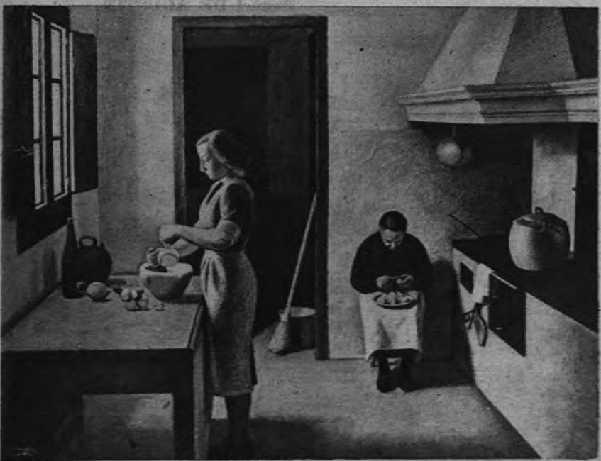
SALON DE LOS ONCE. —En el clásico Salón de los Once, que se inauguró ayer, figura este obra de Miguel Villá, titulada «La cocina». El cuadro de este pintor está siendo objeto de grandes y elogiosos comentarios.