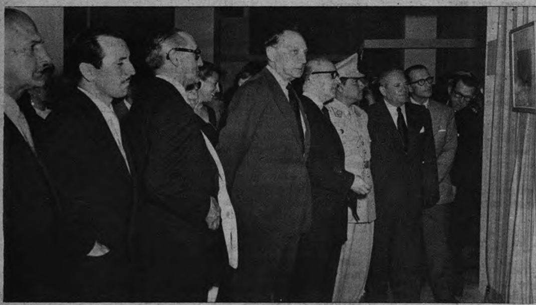
EXPOSICION ESPAÑOLA EN LIMA. —En la ciudad de los Reyes se inauguró con gran éxito la Exposición de Goya y el Grabado Español. Nuestro embajador presidió el acto acompañado por el ministro de Asuntos Exteriores peruano y altas personalidades.