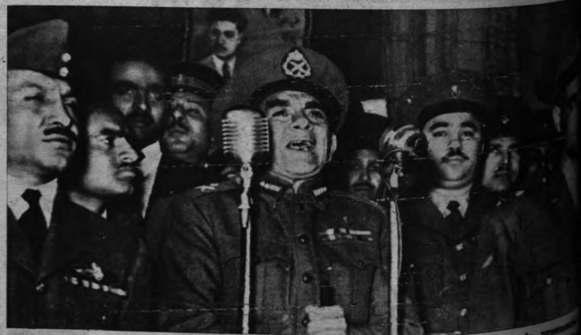
«¡FUERA!». —Ante los estudiantes cairotas, Mohamed Naguib, primer ministro egipcio, pronunció una breve arenga, en la que dijo: «¡Fuera!», refiriéndose a las tropas inglesas que permanecían en Egipto. El general prometió continuar la lucha contra los británicos.