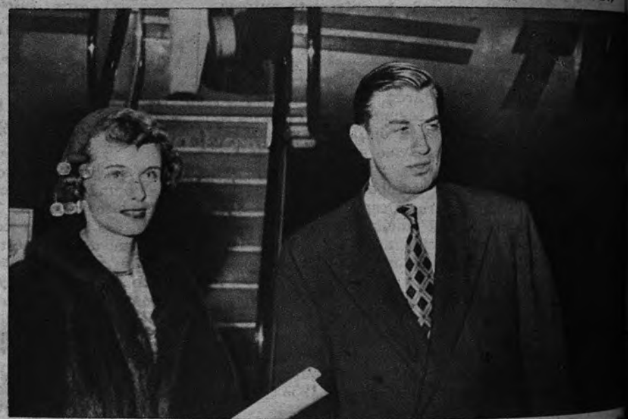
UN ROOSEWELT, EN BARAJAS. —El más joven de los hijos del ex Presidente Roosevelt tocó en Barajas de paso para Nueva York. Permaneció unas horas en nuestra capital. Le esperaban personalidades de la Embajada americana.