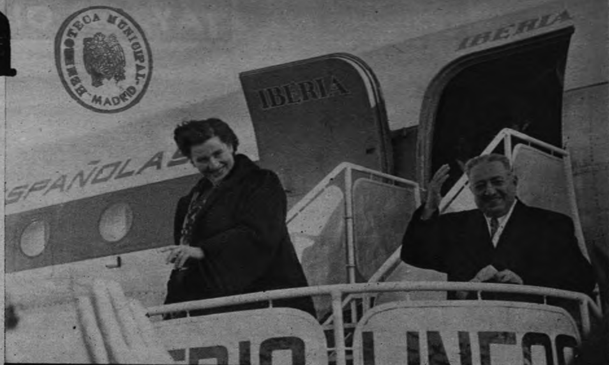
EL DOCTOR RIFAI REGRESA El ministro de Asuntos Exteriores de Siria, doctor Rifai, ha dado por concluida su visita oficial a España. Acompañado de su esposa, desde la escalera del avión, en el aeropuerto de Barajas, dedica sus últimos saludos a quienes acudieron a despedirle.