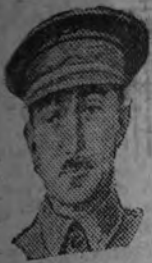
FERNANDO BARRÓN Teniente general del Ejército español, que ayer, en un solemne acto, presidido por el Ministro del Ejército, se posesionó de la presidencia del Consejo Supremo de Justicia Militar.