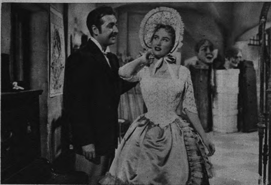
Fernando (Armando Calvo) sonríe, muy amable, sin imaginar que tras la mirada pensativa de Francisquita (Mirtha Legrand) se esconde el más divertido acoso amoroso que mujer alguna ha puesto en práctica.

Y ya que estamos con las estrellas del film, hablemos ahora del galán. Ustedes saben la importancia que tiene el Fernando de «DOÑA FRANCISQUITA». Se necesitaba para él a un primer actor que, además de reunir una gran presencia física, poseyera una voz privilegiada. Muchos fueron los nombres que se barajaron, pero entre todos destacó el de Armando Calvo, nuestro gran actor ganado por el cine mejicano, donde tantos triunfos viene obteniendo. Traerlo de nue-