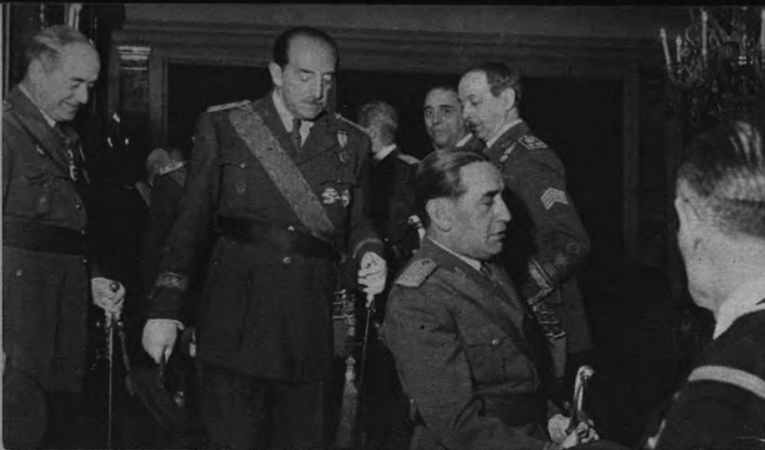
TRIBUNAL DE JUSTICIA MILITAR. —El Ministro del Ejército, general Muñoz Grandes, con el general Barrón, a la salida de la toma de posesión de este último como presidente del Tribunal de Justicia Militar