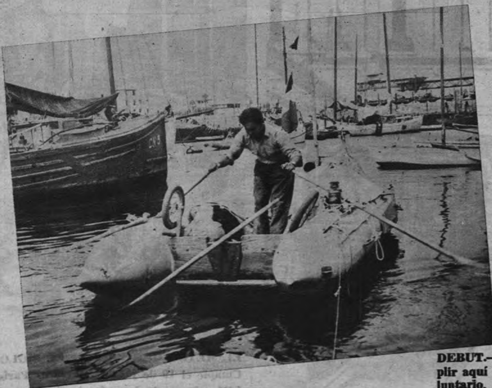
DEBUT. —Alain Bombard acaba de cumplir aquí su primera etapa de naufrago voluntario. Desde Marsella a Casablanca, no hizo otra cosa que entrenarse para el salto

cáscara de nuez en el infinito más que sobre una embarcación verdadera.