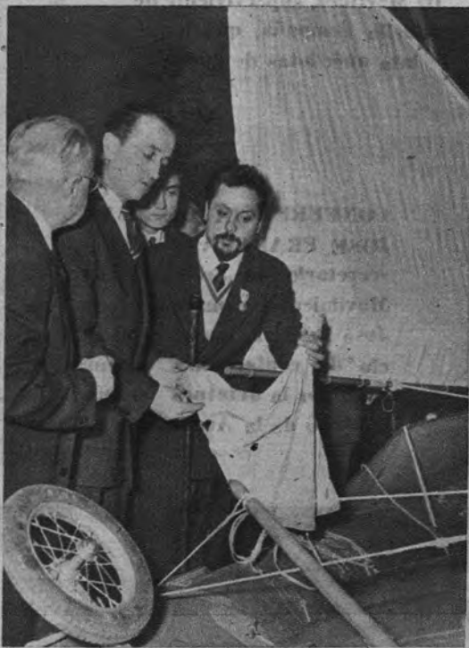
TRIUNFO. —A bordo de la balsa «L'Heretique», el famoso Bombard ganó, entre otras cosas, la Medalla de Oro de la Educación Física y los Deportes. Después de recibirla, Bombard explica al ministro ciertos secretos