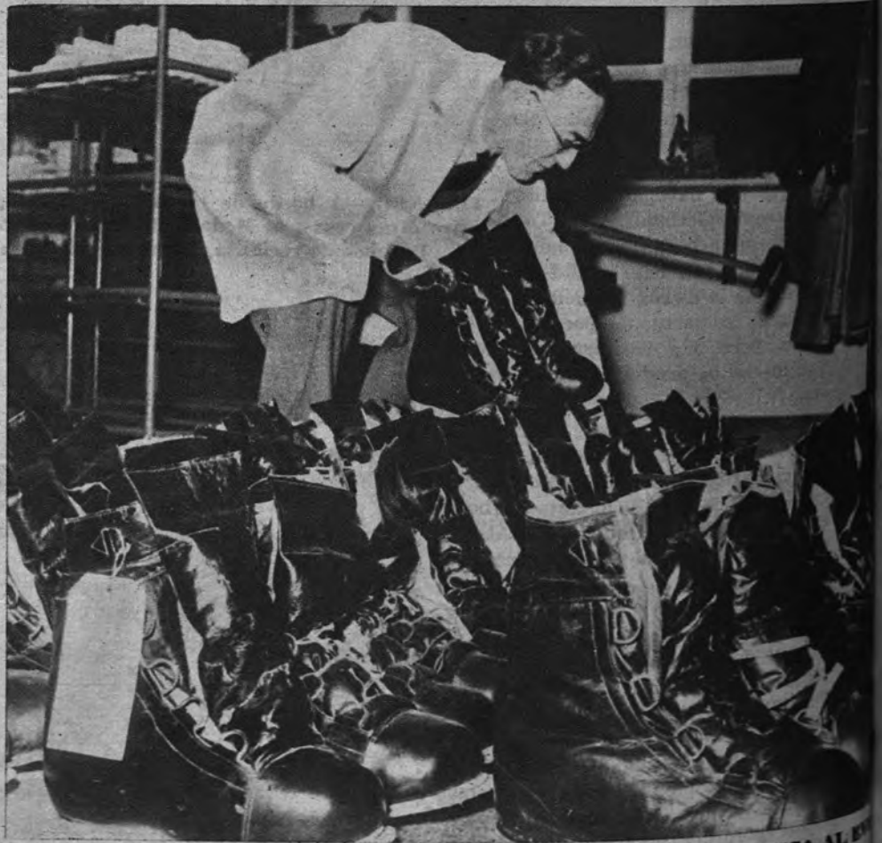
EL METRO QUE VA CON EL SIGLO. —Cumple el 19 de julio el Metro de París el LIII aniversario de su fundación. De la Exposición conmemorativa, aquí vemos una