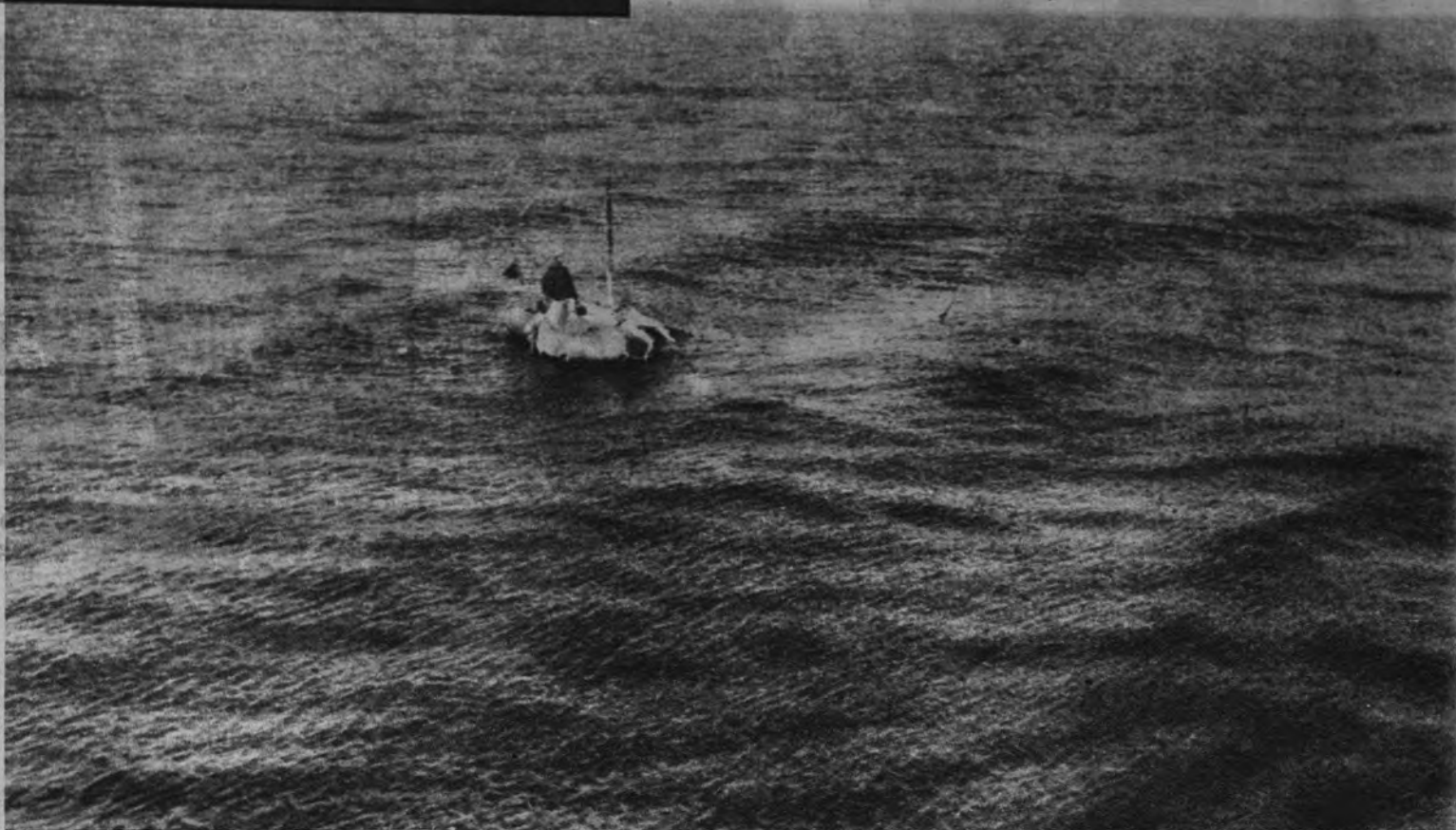
NAUFRAGO. —Más o menos, ésta es la estampa clásica del desventurado a quien la mar puso en trágica situación. En este caso, el doctor Bombard se buscó la catástrofe por propia voluntad y con fines científicos.

Las últimas novedades en materia de osadía náutica se deben a los expedicionarios de la balsa «Kon-Tiki», en el Pacífico, y al tripulante del bote neumático «L'Heretique», en el Atlántico. Demostrar que los indígenas de la Polinesia son de origen americano, como lo ha hecho Thor Heyerdahl, o que un naufrago puede vivir en el mar y del propio mar, como lo ha hecho Alain Bombard, tiene la enorme importancia de todas las teorías comprobadas, y tanta o más a título de aventuras asombrosas. Concretamente a Bombard, que durante las sesenta y cinco singladuras de su travesía entre las Canarias y las Barbados perdió veinte kilos de peso, le hicieron desde un buque británico esa impresionante fotografía en la que parece navegar sobre el tónico de la