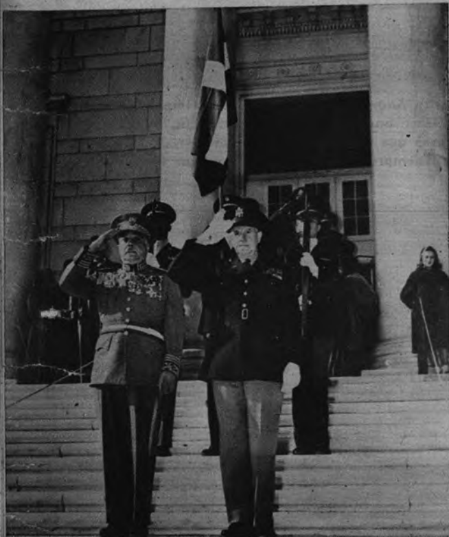
EL GENERALISIMO TRUJILLO, EN ARLINGTON. —Rafael L. Trujillo, antiguo Presidente dominicano, saluda ante el monumento al Soldado Desconocido durante su visita al cementerio nacional de Arlington (Virginia)