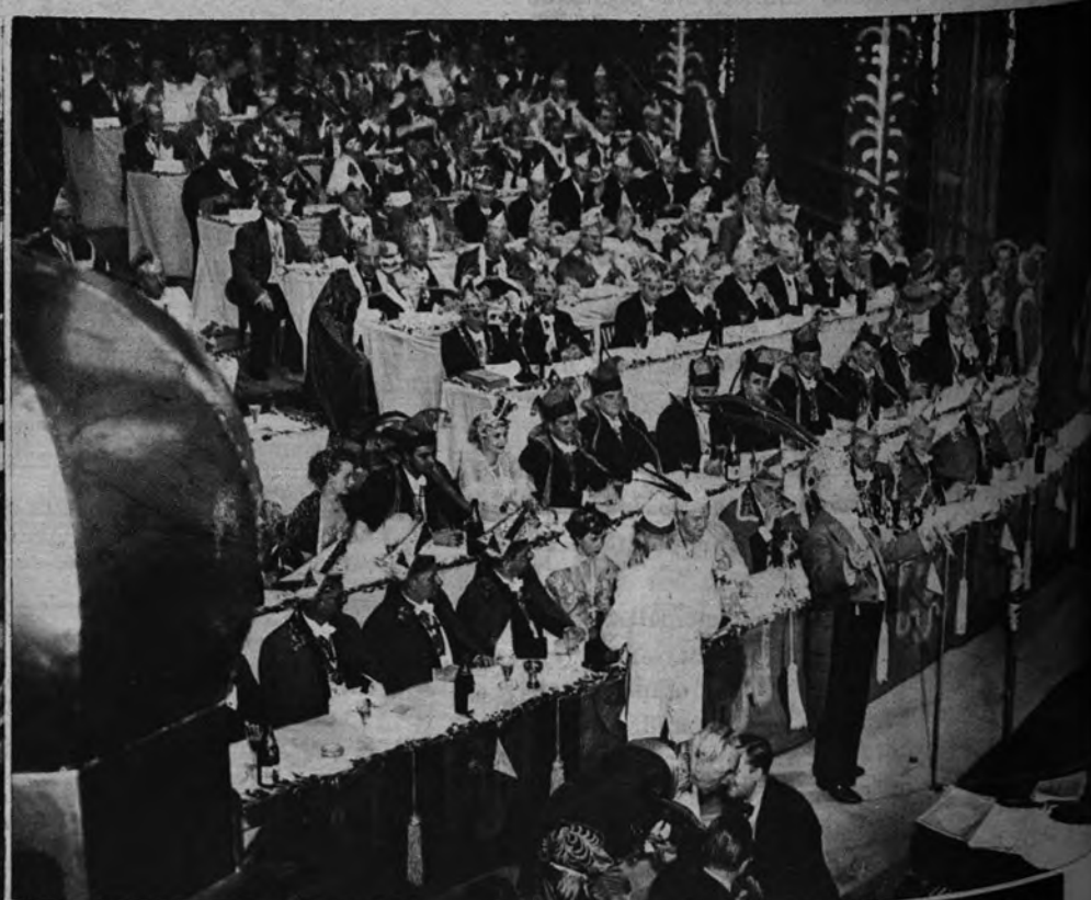
TODO EL AÑO NO ES CARNAVAL. —Delegados del Carnaval de diversas regiones alemanas se han reunido en Munich para acordar la formación de la Liga Alemana del Carnaval «para aunar criterios y esfuerzos destinados a las diversiones de dichas fiestas», para escuchar el discurso de su presidente, Akbrecht Bett s. de Colonia; para aturdirse grotescamente y, por lo visto, para olvidarse de cosas como la que representa la segunda fotografía: un campo de refugiados en el Berlín occidental, a donde diariamente afluyen gran número de alemanes que huyen del dominio comunista.