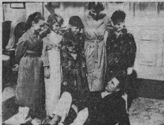
«HOGAR, DULCE HOGAR»

Warner Bros nos ofrecerá muy pronto una encantadora cinecomedia titulada «Hogar, dulce hogar». Todo el público de Madrid queda invitado a visitar este dulce y divertidísimo hogar de los Rose—por otros nombres, Cary Grant y Betsy Drake—, simpático matrimonio esclavo de la hospitalidad