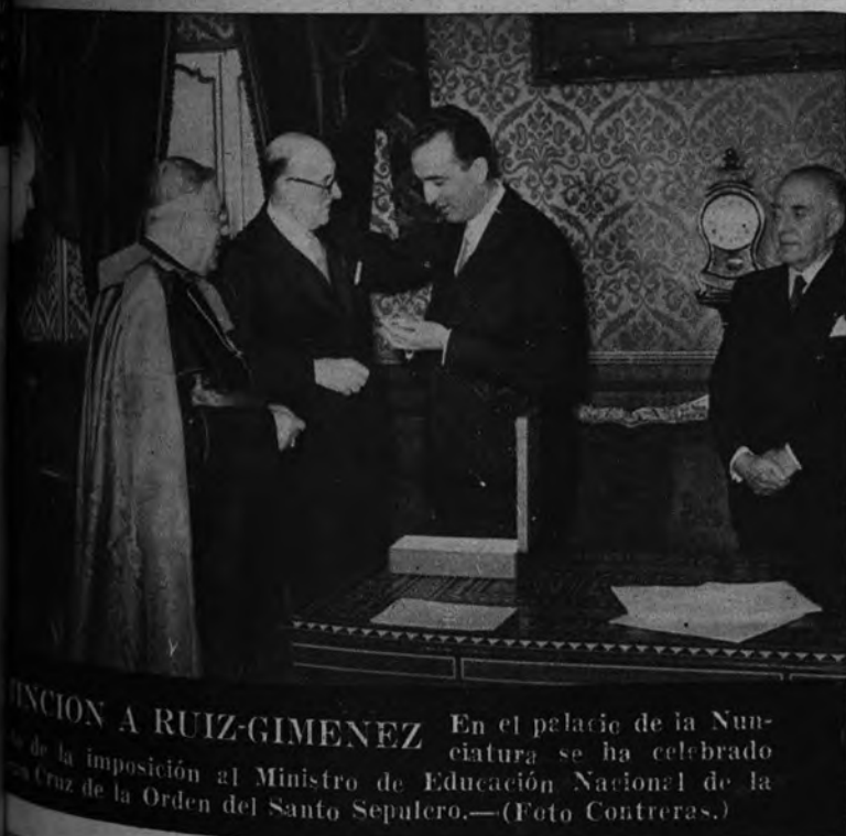
INICIACION A RUIZ-GIMENEZ En el palacio de la Nunciatura se ha celebrado la imposición al Ministro de Educación Nacional de la Cruz de la Orden del Santo Sepulcro.

Quizá ninguna fotografía logre expresar mejor que ésta toda la angustia que ha prendido en el corazón de la hermosa Holanda. Madre e hijo, salvados después de dos días de cerco en la tempestad, lloran abrumados por la emoción. La foto fué tomada en Gravendeel, a donde pertenecen el diez por ciento del total de víctimas. (Más información en la página siguiente.)