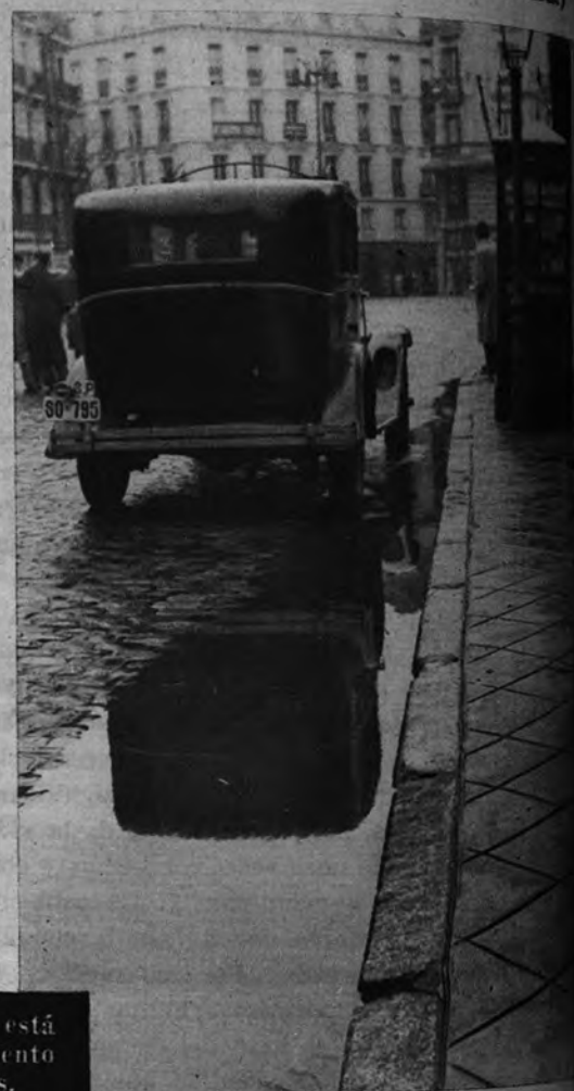
LLUVIA SOBRE LA CIUDAD. —Persistente y manuda, la lluvia está dando a Madrid sus últimos lustres invernales. A favor del pavimento y en contra del peatón, el agua se acumula en pequeños embalses.