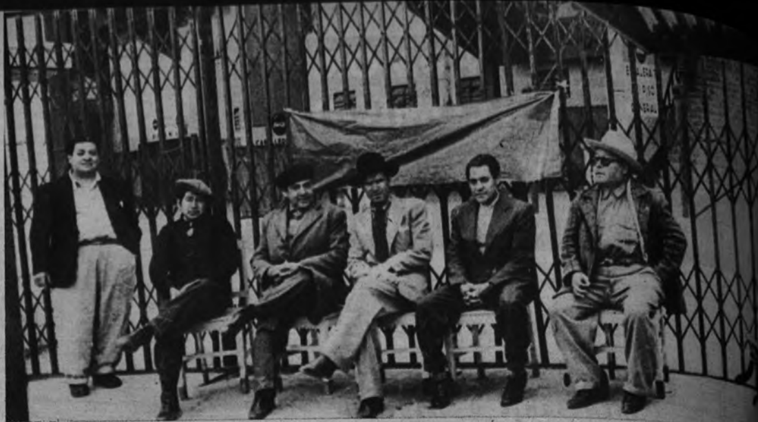
HUELGA DE BANDERILLEROS Y PICADORES. —En la plaza de toros de México, banderilleros y picadores, con la bandera roja y negra, se turnan en la guardia para evitar la acción de los esquirols.