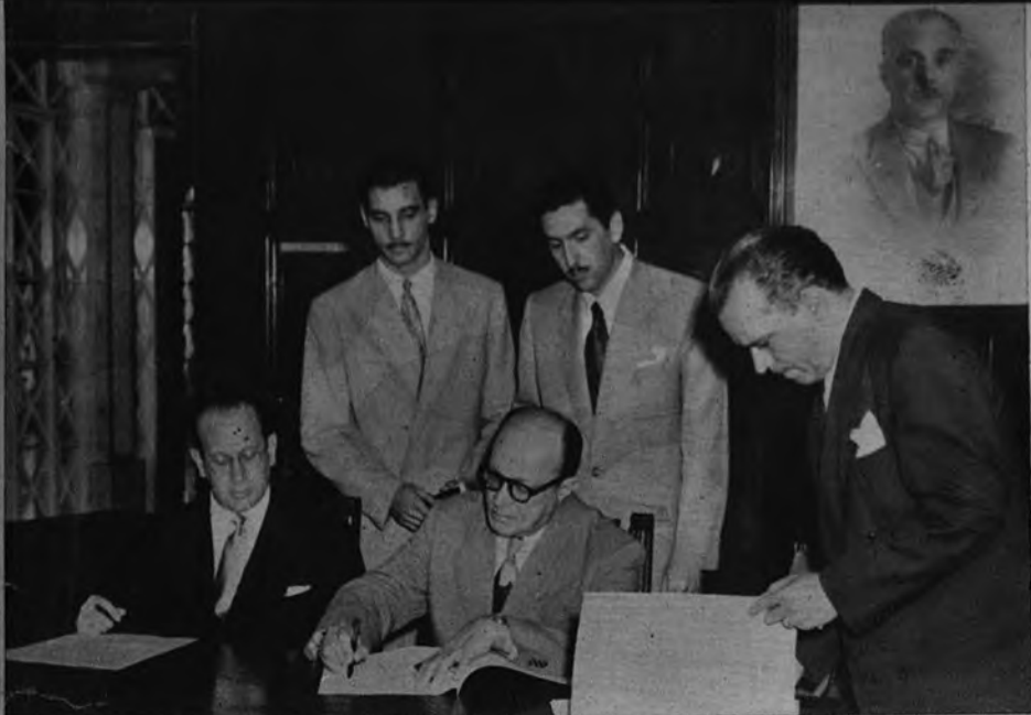
CONVENIO CULTURAL HISPANODOMINICANO. —El embajador de España en Santo Domingo, don Manuel Valdés Larrañaga, y el ministro de Relaciones Exteriores, don Virgilio Díaz, durante la firma del convenio