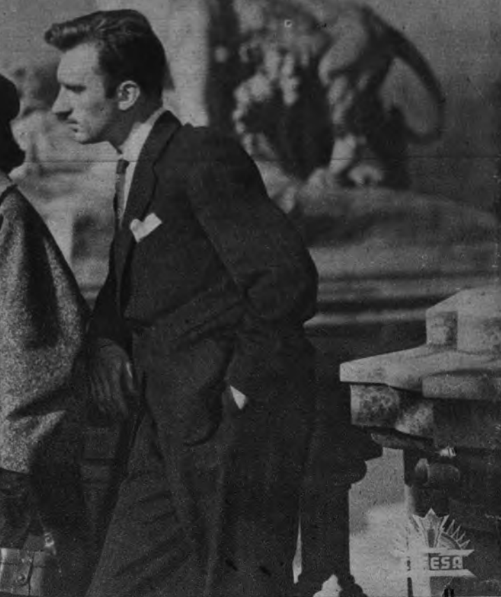
Margarita Andrey y Fernando Fernán-Gómez, en pleno idilio. Hace unos minutos ni se conocían. Y ahora viven cosas que si ella tardará en olvidarias, él las recordará siempre, porque, señores, ¡hay que ver las cosas que el pobre vive!

va de sorpresa en sorpresa, todas ellas agradables. Julia Caba Alba y Juan Vázquez llevan la nota cómica del film, en la interpretación de un matrimonio bobalicon, premiado en un concurso, que ante la idea de tener que subir por primera vez a un avión, toman las más chuscas y exageradas prevenciones, dando lugar a que el público ría